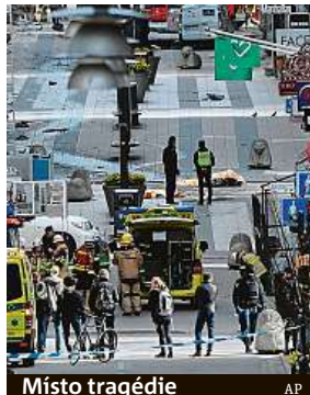
Místo tragédie

Stoupenec organizace Islámský stát (IS), jemuž bylo v době útoku 39 let, se již dříve v činu přiznal. Uvedl, že chtěl potrestat Švédsko za účast v mezinárodní koalici proti Islámskému státu.