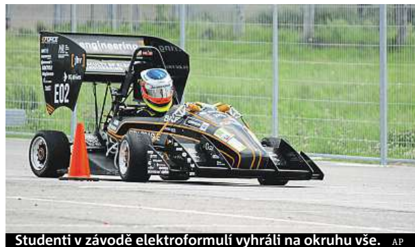
Studenti v závodě elektroformulí vyhráli na okruhu vše.

Soutěže Formula Student vedle závodů na okruhu zahrnuje také prezentaci konstrukce a řešení formule a představení obchodního plánu před porotou. Základ