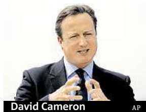
David Cameron

Včera úderem půlnoci skončil časový limit pro přihlášení se k referendu o setrvání Británie v Evropské unii. Průzkumy veřejného mínění ukazují velmi vyrovnaný stav. Jen nepatrně ve většině z nich vedou odpůrci takzvaného brexitu, tedy příznivci setrvání v Unii. Podle francouzských médií zase vedou o dvě procenta příznivci opuštění EU. O výhodách členství Británie v Evropské unii včera ve vysílání televize ITV Britý přesvědčoval sám premiér David Cameron. ČTK