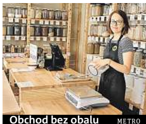
Obchod bez obalu METRO

Denně do obchodu přijde zhruba 50 zákazníků. „Chtějí hlavně mouku, vločky a luštěniny. Pokud zrovna nemají