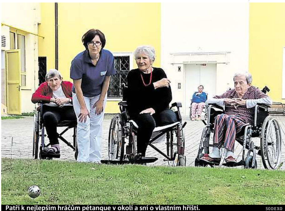
Patří k nejlepším hráčům pétanque v okolí a sní o vlastním hřišti.

Do letošního ročníku sbírky se přihlásili s přáním na vybu-