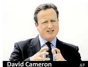
David Cameron

Včera úderem půlnoci skončil časový limit pro přihlášení se k referendu o setrvání Británie v Evropské unii. Průzkumy veřejného mínění ukazují velmi vyrovnaný stav. Jen nepatrně ve většině z nich vedou odpůrci takzvaného brexitu, tedy příznivci setrvání v Unii. Podle francouzských médií zase vedou o dvě procenta příznivci opuštění EU. O výhodách členství Británie v Evropské unii včera ve vysílání televize ITV Britý přesvědčoval sám premiér David Cameron.