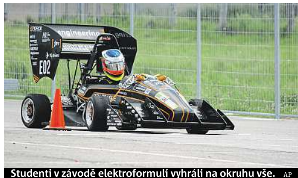
Studenti v závodě elektroformulí vyhráli na okruhu vše.

Soutěže Formula Student vedle závodů na okruhu zahrnuje také prezentaci konstrukce a řešení formule a představení obchodního plánu před porotou. Základ