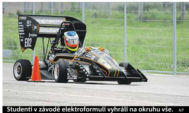
Studenti v závodě elektroformulí vyhráli na okruhu vše.

Soutěže Formula Student vedle závodů na okruhu zahrnuje také prezentaci konstrukce a řešení formule a představení obchodního plánu před porotou. Základ