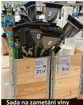
Sada na zametání viny

Kielbowicz pro polská média uvedl, že ho k výrobě těchto štítků inspirovaly případy z ruských obchodů, kde se místo etiket s cenami zboží