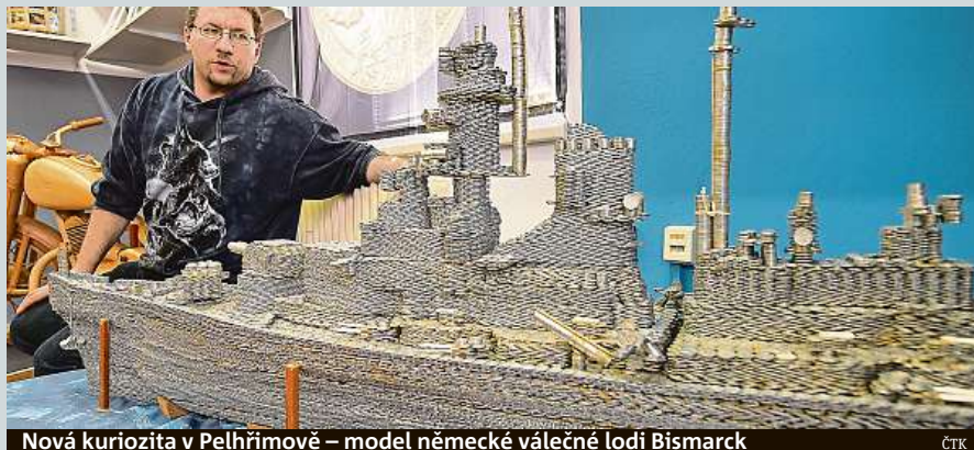
Nová kuriozita v Pelhřimově – model německé válečné lodi Bismarck