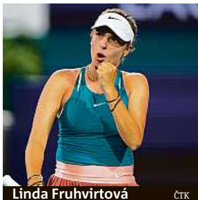
Linda Fruhvirtová

Zraněná světová deblová jednička Kateřina Siniaková vypadla z nominace tenistek na duel s Velkou Británií v kvalifikaci o postup na finálový turnaj Poháru Billie Jean Kingové. Kapitán Petr Pála dnes oznámil, že tým doplní Marie Bouzková a premié-