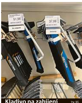
Kladivo na zabíjení 2x 1G

objevovaly informace o ruské agresi vůči Ukrajině a jejímu lidu.