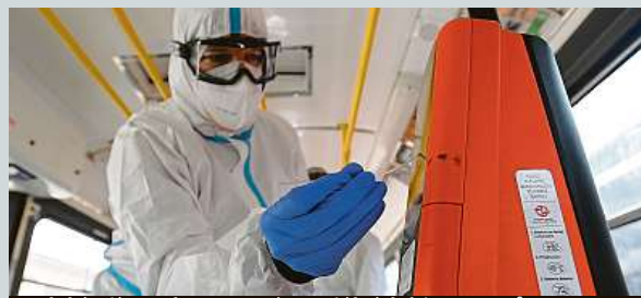
Odebírají vzorky pomocí speciálních biosenzorů.