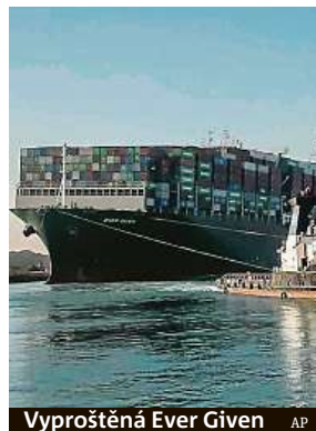
Vyproštěná Ever Given

Následně šéf Suezsku pohovořil o osudu Ever Given, kte-