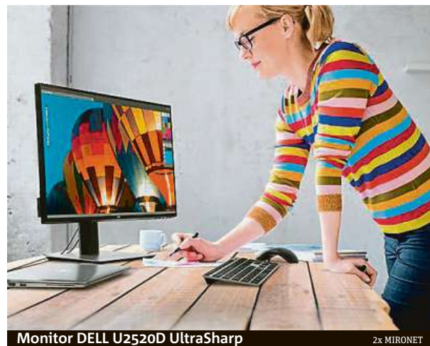
Monitor DELL U2520D UltraSharp

Jedním z takovýchto monitorů je model U2520D UltraSharp. Nabízí na úhlopříčce 25 palců jemné QHD rozlišení (2560 x 1440 pixelů) a úžasně 99% pokrytí barevného prostoru sRGB. Monitor je navíc kalibrován již z výroby, takže vám bude stačit jej vybalit, zapnout a můžete se