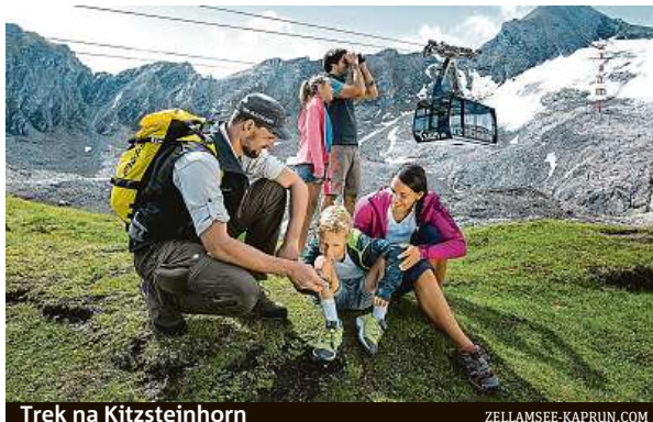
Trek na Kitzsteinhorn

Bohatá nabídka vyžití tady čeká také na cyklisty. Kolem