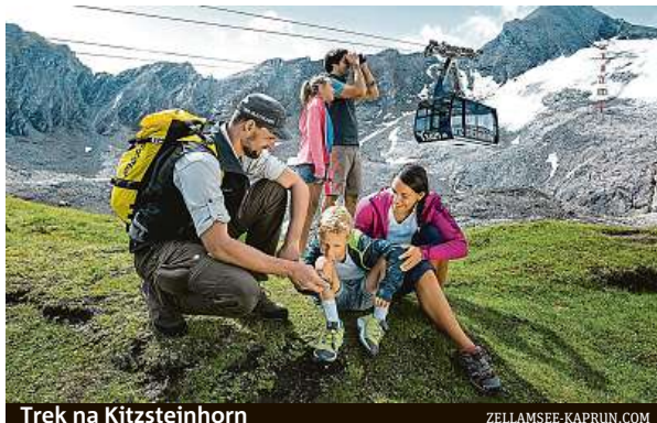
Trek na Kitzsteinhorn

Bohatá nabídka vyžití tady čeká také na cyklisty. Kolem