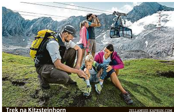
Trek na Kitzsteinhorn

Bohatá nabídka vyžití tady čeká také na cyklisty. Kolem