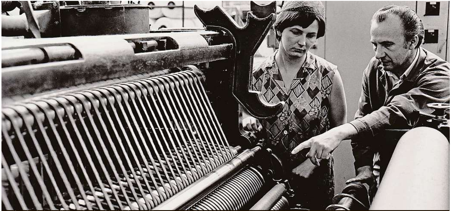
Kniha obsahuje i velké množství archivních fotografií.