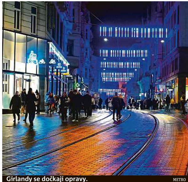
Girlandy se dočkají opravy.

Od ledna začalo studio pracovat na návrhu a samotné výrobě nových součástek, které opravují konstrukční chybu. Jako nejvhodnější se ukázala technologie 3D tisku v spolupráci s brněnskou digi-