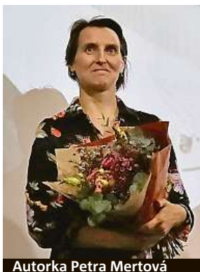
Autorka Petra Mertová

Vlněna ve vzpomínkách je plná výpovědí pamětníků pohybujících se v lehkém průmyslu.