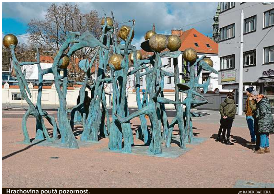
Hrachovina poutá pozornost.