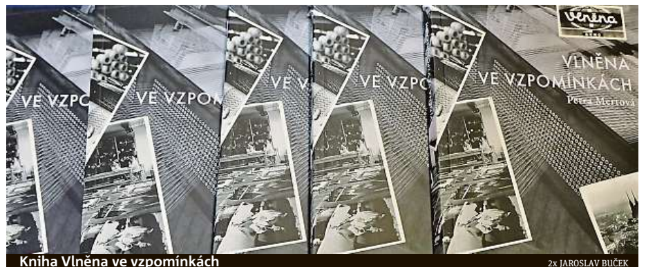
Kniha Vlněna ve vzpomínkách