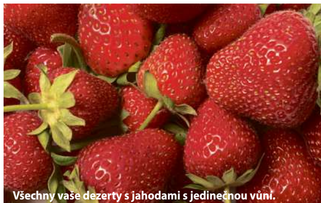
Všechny vaše dezerty s jahodami s jedinečnou vůní.