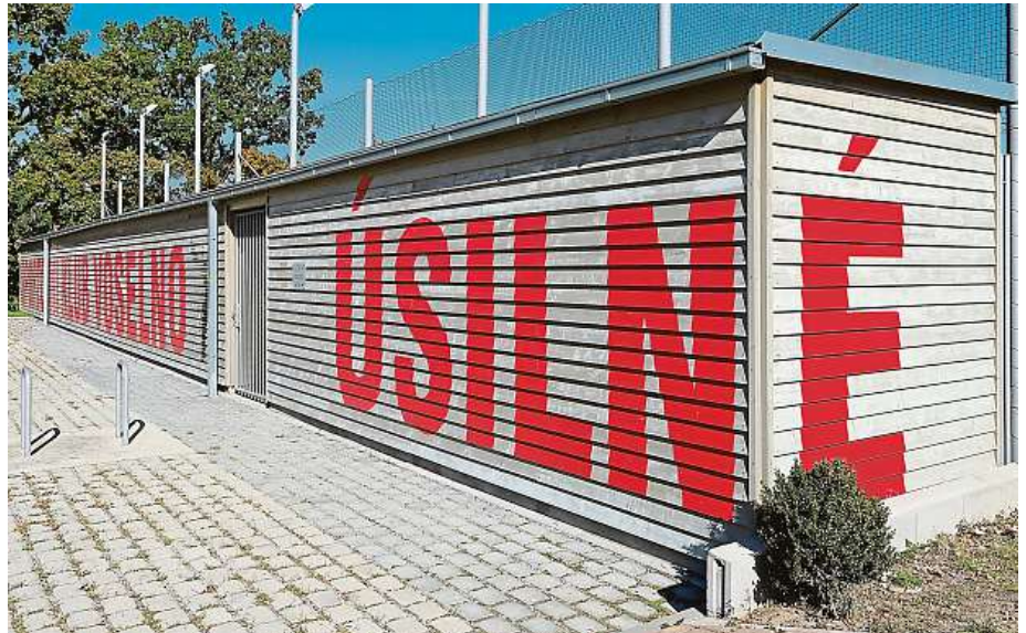
V Úsilném kousek od Českých Budějovic mají sportoviště nejen pro návštěvníky obce. 4x PIAŘISTI