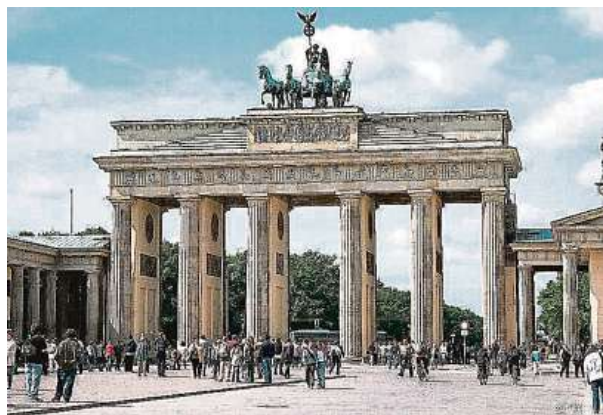
Oslavy proběhnou i u Braniborské brány.