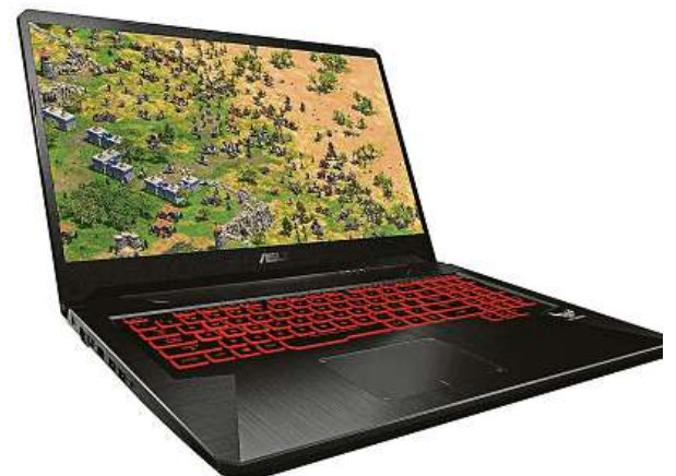
Stroj pro nejnáročnější hráče

K tomuto notebooku navíc zdarma dostanete originální externí DVD vypalovačku ASUS v hodnotě 1490 korun.