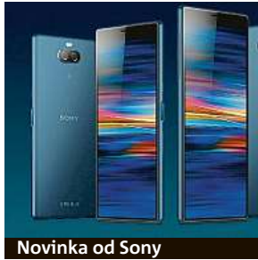
Novinka od Sony

Před pár dny představila firma Sony na veletrhu v Barceloně nové telefony Xperia 10, Xperia 10 Plus a Xperia L3. My se dnes zaměříme na prv-