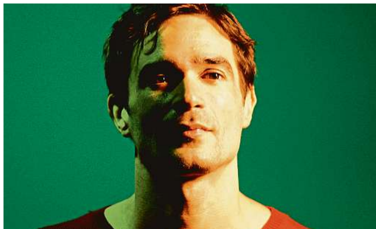
Hopkins patří k nové generaci talentovaných experimentátorů. SPECTACULARE