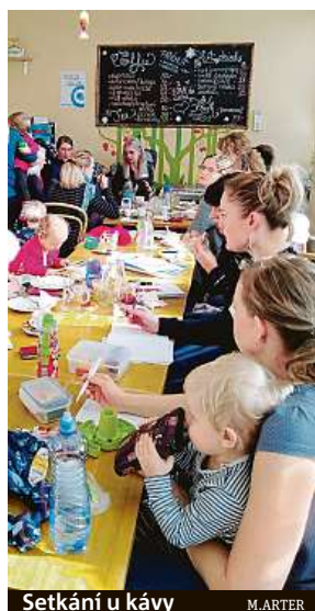
Setkání u kávy

Výzvo pro většinu matek je otázka, jak skloubit péči o dítě, domácnost, manžela, sebe, k tomu se věnovat práci a vše to ustát. „Proto hodně holek hledá cesty, jak si dobíjet energii, ať už jógou, nebo sportem, někomu zase pomáhají relaxační techniky či aromaterapie. V momentě, kdy toto máma zvládne, je připravena se poprat s většinou výzev na trhu práce,“ dodává Rybková Kuráková.