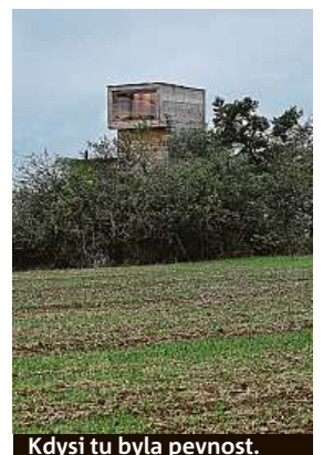
Kdysi tu byla pevnost.