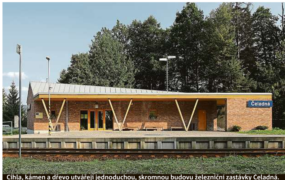
Čihla, kámen a dřevo utvářejí jednoduchou, skromnou budovu železniční zastávky Celadná.