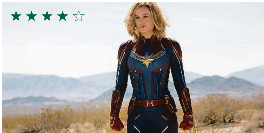
Captain Marvel je jednohubka, která poslouží jako fajn předkrm před Avengers. FALCON

Vyrazit do kina na dobrodružství ze světa Marvelu se stalo pro miliardy diváků po celém světě zárukou zábavného večera. Studio, které vede železnou rukou jeho prezident Kevin Feige, totiž dosud nemá na kontě jediný vyloženě špatný film. Ať si škarohlídi z řad recenzentů i těch, kterým se komiksovky v kinech již přejedly, říkají, co chtějí. Komiksově filmy budou ještě