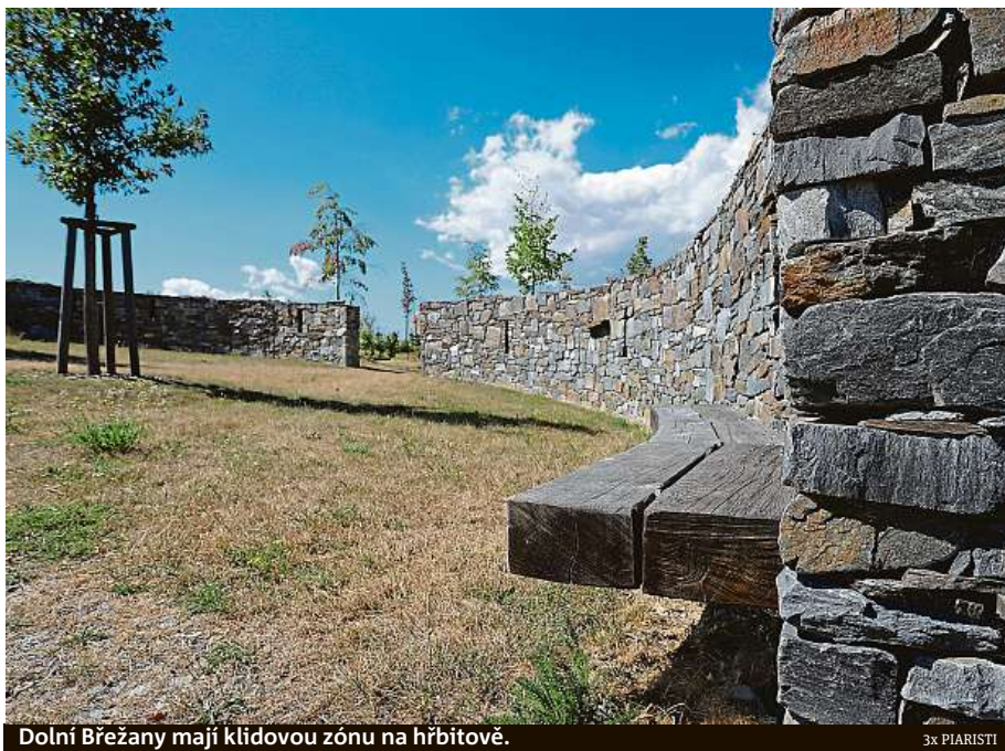
Dolní Břežany mají klidovou zónu na hřbitově.

Mezi takové stavby patří i rozhledna Růženka v obci Růžová od libereckého studia