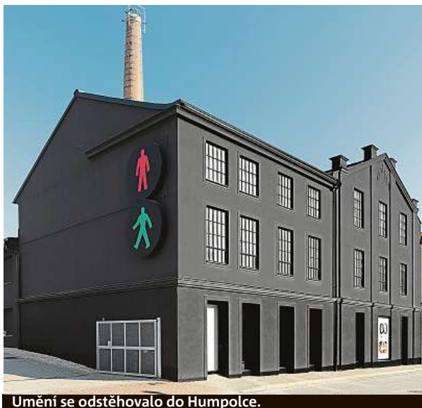
Umění se odstěhovalo do Humpolce.

V Dolních Břežanech byla před třemi lety dokončena odpočinková zóna, tedy krajinářský park se hřbitovem. Vznik jeho kulatých kamenných zdí, na které si místní stále ještě zvykají, je v knize rovněž detailně popsán a zdokumentován.