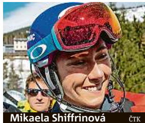
Mikaela Shiffrinová ČTK

Přes teplé počasí má být sjezdovka pro Světový pohár v dobrém stavu.