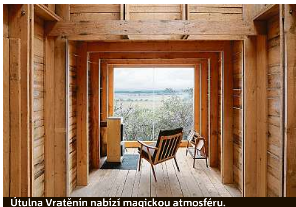
Útulna Vratěnin nabízí magickou atmosféru.