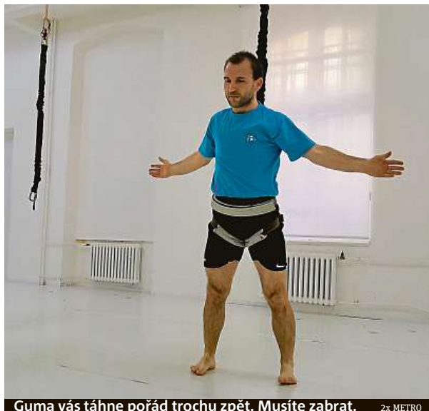
Guma vás táhne pořád trochu zpět. Musíte zabrat.