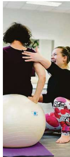
Cvičení na míčích