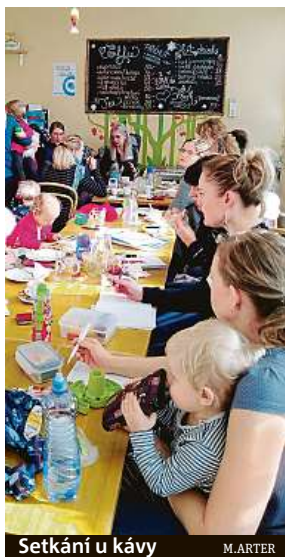
Setkání u kávy

Výzvou pro většinu matek je otázka, jak skloubit péči o dítě, domácnost, manžela, sebe, k tomu se věnovat práci a vše to ustát. „Proto hodně holek hledá cesty, jak si dobíjet energii, ať už jógou, nebo sportem, někomu zase pomáhají relaxační techniky či aromaterapie. V momentě, kdy toto máma zvládne, je připravena se poprat s většinou výzev na trhu práce,“ dodává Rybková Kuráková.