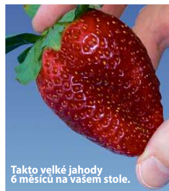
Takto velké jahody 6 měsíců na vašem stole.

Ano, nyní se již nepotřebujete ohýbat, abyste sbírali na zemi a v blátě jahody, které napadli živočichové ještě předtím, než byly zralé.