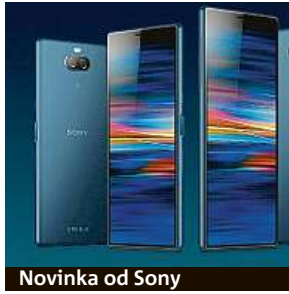
Novinka od Sony

Před pár dny představila firma Sony na veletrhu v Barceloně nové telefony Xperia 10, Xperia 10 Plus a Xperia L3. My se dnes zaměříme na prv-