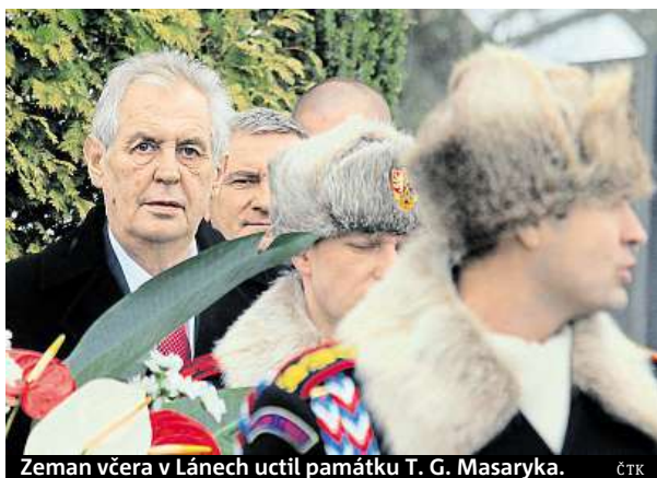
Zeman včera v Lánech uctil památku T. G. Masaryka.