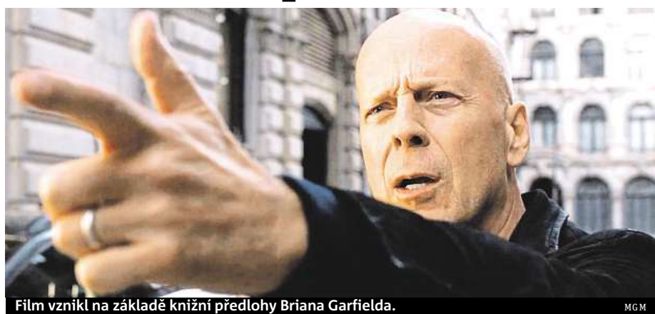
Film vznikl na základě knižní předlohy Briana Garfielda.

Bruce Willis, Vincent D'Onofrio a Elisabeth Shue hrají po jednom boku v nové verzi klasického thrilleru s názvem Přání smrti . Jedná se o akční thriller, kde nebude chybět napětí, láska, odplata, hrdinství a touha po spravedlnosti. Bruce Willis jako doktor Paul Kersey, milující otec a manžel, vezme zákon do vlastních rukou, aby pomstil tragickou událost ve své rodině. Režie se ujal producent, režisér, scenárista i herec Eli Roth, známý například z hororu Hostel , kde oba díly režíroval. MET