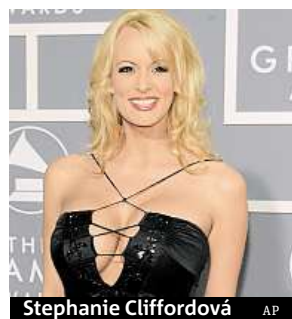
Stephanie Cliffordová

Cliffordová, která je v pornobranži známá jako Stormy