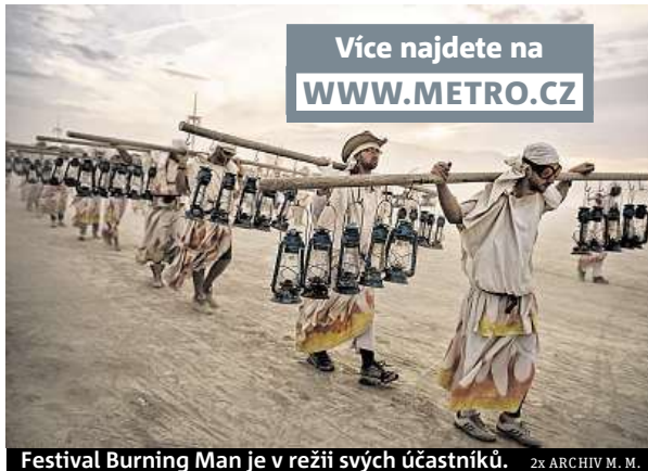
Festival Burning Man je v režii svých účastníků.

V roce 2016 jsem byl poprvé. Kromě životního zážitku jsem si odvezl i soubor fotek, který v Čechách vzbudil velký ohlas. Další rok jsem se vydal i na dva největší sesterské festivaly, v africké poušti Tankwa a v izraelské Negevské poušti. Celý soubor jsem symbolicky uzavřel návštěvou amerického Burning Mana. Takže na tom velkém americkém jsem byl dvakrát, a tuším, že ne naposledy.