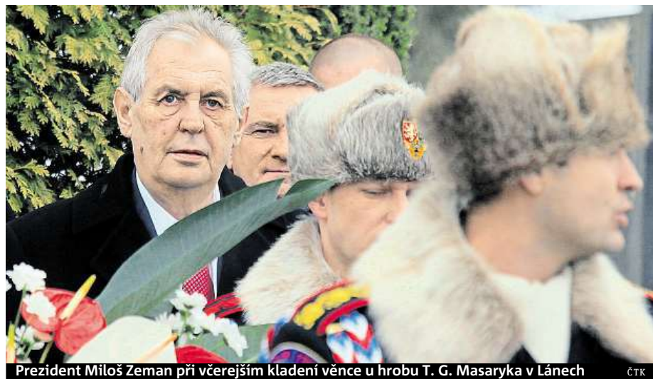
Prezident Miloš Zeman při věrejší kladení věnce u hrobu T. G. Masaryka v Lánech