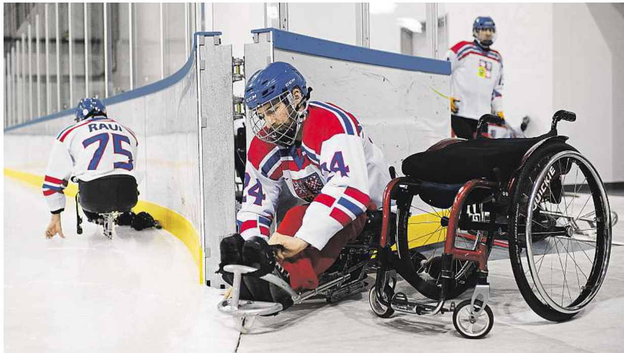
V Koreji zítra startuje zimní paralympiáda. Včera se na led při tréninku dostali i čeští sledge hokejisté.

Konkurence. Lidé mohou očekávat nižší poplatky či výhodnější úrokové sazby. Na splátky. Češi si nejvíc půjčují na chytré telefony, televize a vybavení domácností. Rizika. V loňském roce přibýlo exekucí STRANA 2