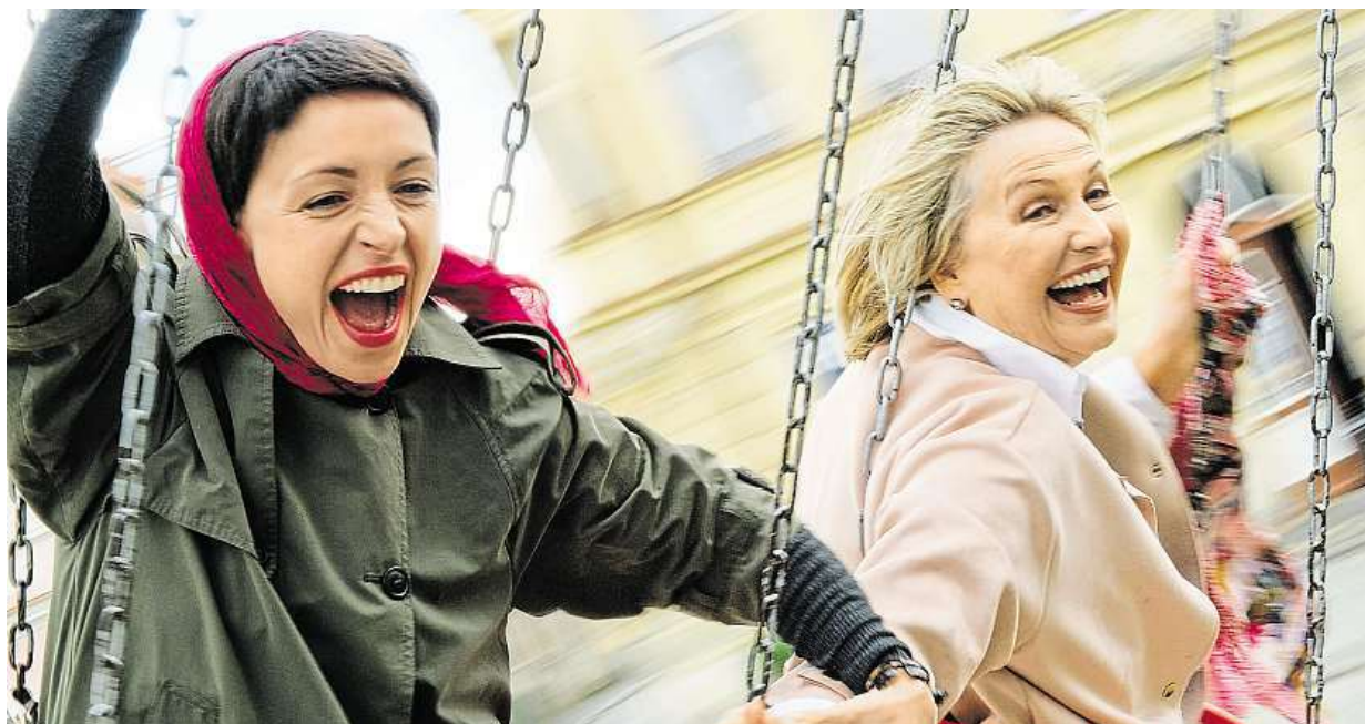
O obsazení hlavních rolí měl režisér jasně prakticky hned po přečtení scénáře.