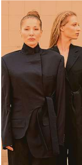
Kolekce inspirovaná filmovými festivaly ON THE BOAT