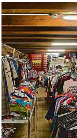
V sekáči to může vypadat i takhle. OBLECENISVYCARSKO.CZ