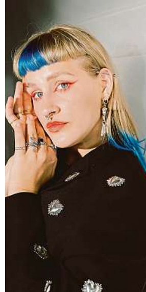
I zpěvačka Aiko měla svou upcyklovanou kolekci.