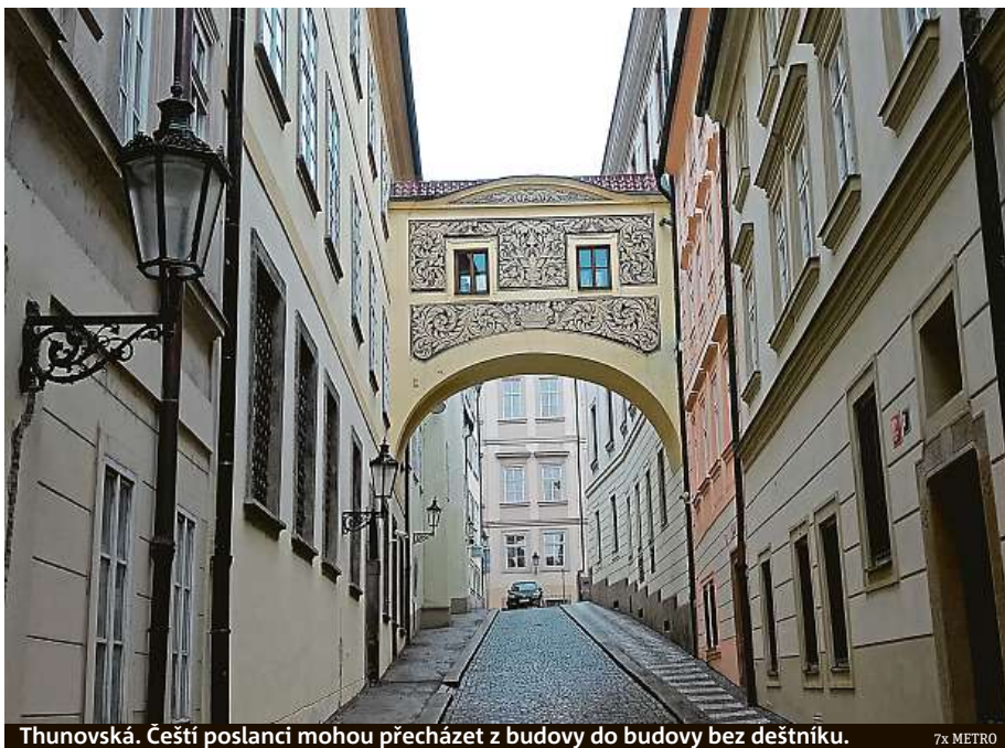
Thunovská. Čeští poslanci mohou přecházet z budovy do budovy bez deštníku.

Moderní „prampouchy“ jako spojovací mosty mezi domy ale najdete i v současnosti. Zřejmě tím nejvyšším je spojovací chodba v 19. patře mezi dvěma věžemi Kupy, v současnosti ubytovny na sídlišti Jižní Město. Spojovací chodba vede do restaurace na střeše budovy.