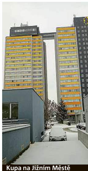
Kupa na Jižním Městě

Moderního „prampouchu“ se dočkala také Česká televize. Když totiž v 90. letech dostavěli naproti původnímu centrálnímu areálu provozní budovu zvanou Rohlík, obcházení a dlouhé přebíhání přes ulici Na Klauďiánce vyřešili stavbaři spojovacím, v současnosti velice frekventovaným tunelem klenutým se nad poměrně frekventovanou vozovkou. PAVEL HRABICA