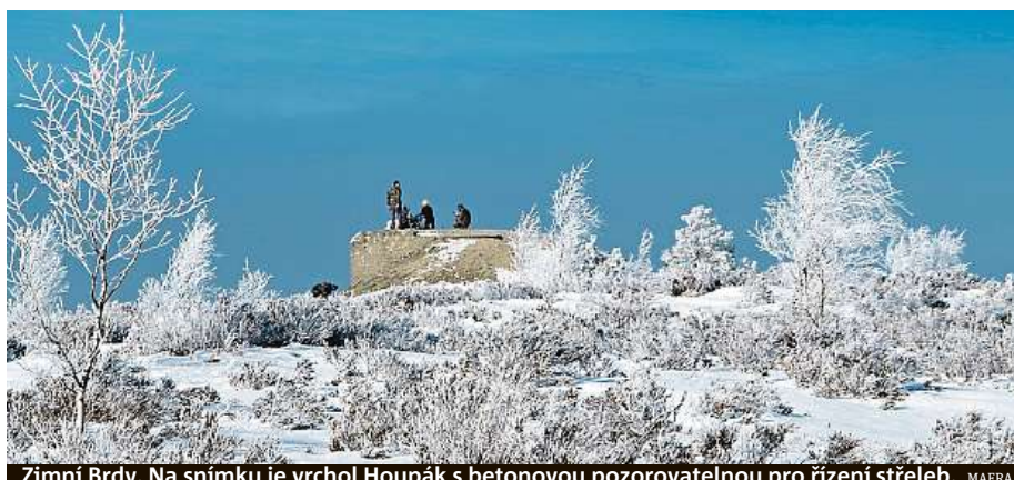
Zimní Brdy. Na snímku je vrchol Houpák s betonovou pozorovatelnou pro řízení střelb. MAERA

Udělejte něco pro své fyzické i duševní zdraví, poznejte kus Brd a vyrazte na vrcholy. Nejlépe s přáteli.