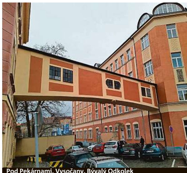
Pod Pekárkami, Vysočany. Bývalý Odkolek