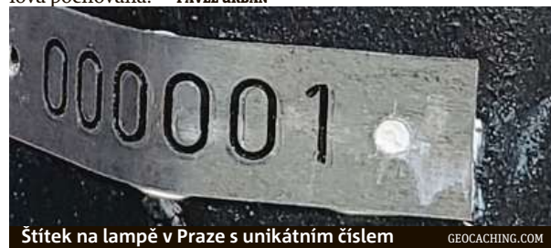
Štítek na lampě v Praze s unikátním číslem