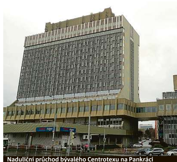
Naduliční průchod bývalého Centrotexu na Pankráci