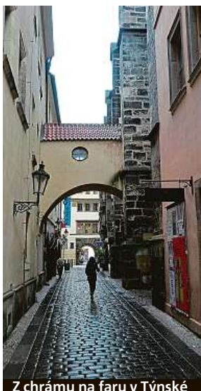
Z chrámu na faru v Týnské