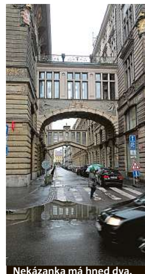
Nekázanka má hned dva.