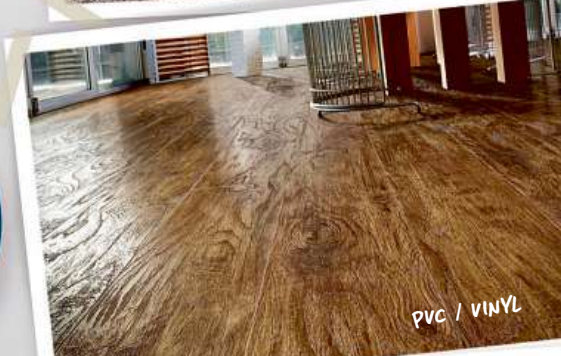
PVC / VINYL