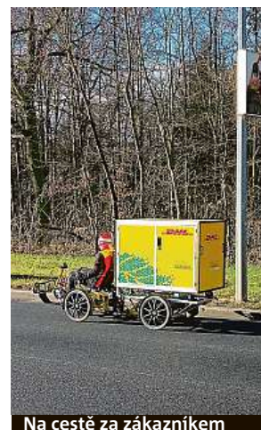
Na cestě za zákazníkem

Tolik zásilek denně rozveze jeden kurýř z centrálního cyklo depa v Praze na Florenci.