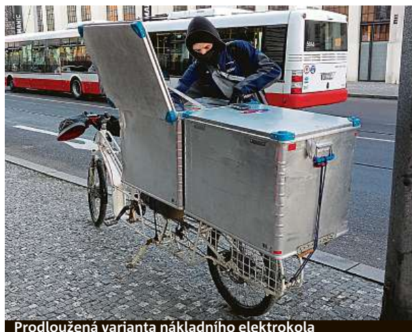
Prodloužená varianta nákladního elektrokola

někam na vyhlídky, kam by se jinak tito lidé sami nedostali,“ říká Haspeklo.