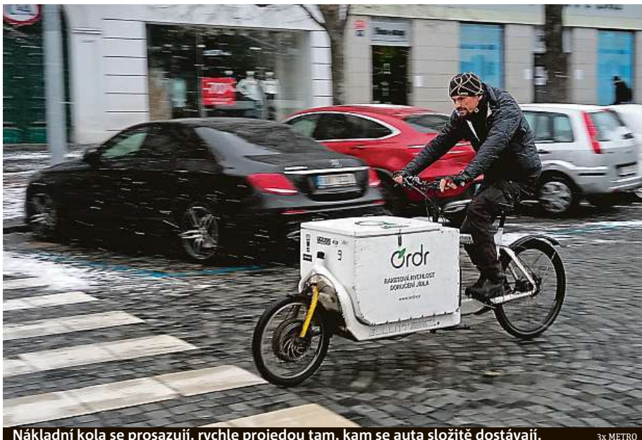
Nákladní kola se prosazují, rychle projedou tam, kam se auta složitě dostávají.

O co je prý v Brně zájem, to jsou kola s názvem Taxi, která slouží k přepravě osob. Požadavky směřují právě na úpravu s elektrickým příslapem, protože Brno není rovina, jako například Hradec Králové nebo Poděbrady. „Pořizují je buď domovy pro seniory, různé služby pro tyto domovy, nebo nadace. Využívají je, aby mohly vozit méně pohyblivé staré lidi na výlety,