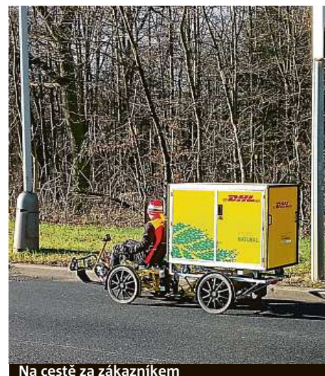
Na cestě za zákazníkem