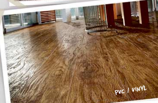
PVC / VINYL