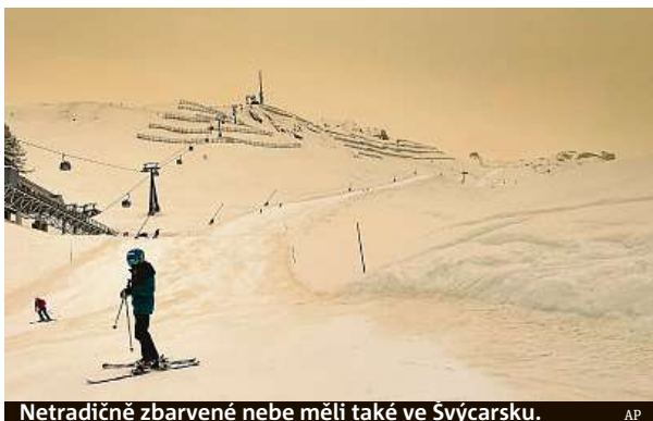
Netradičně zbarvené nebe měli také ve Švýcarsku.

Minulý týden se v celé Evropě vytvořila dynamická struktura s přetrvávajícím nejvyšším stupněm nad arktickou oblastí a severní Evropou. Avšak na jihu táhne atmosfé-