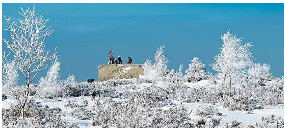
Zimní Brdy. Na snímku je vrchol Houpák s betonovou pozorovatelnou pro řízení střelb.

Udělejte něco pro své fyzické i duševní zdraví, poznejte kus Brd a vyrazte na vrcholy. Nejlepší s přáteli.