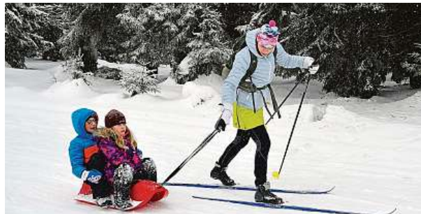
Nánosy sněhu dělají radost hlavně lyžařům a dětem.

Teploty mohou v noci podle týden- ní předpovědi klesnout až pod -15 °C.