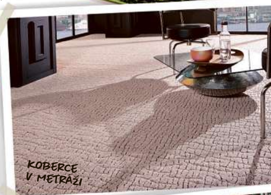
KOBERCE V METRAŽI