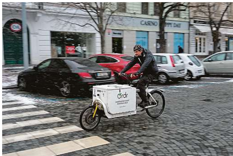
Nákladní kola projedou tam, kam se auta složitě dostávají.