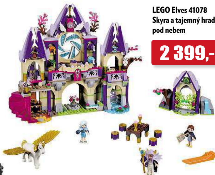
LEGO Elves 41078 Skyra a tajemný hrad pod nebem