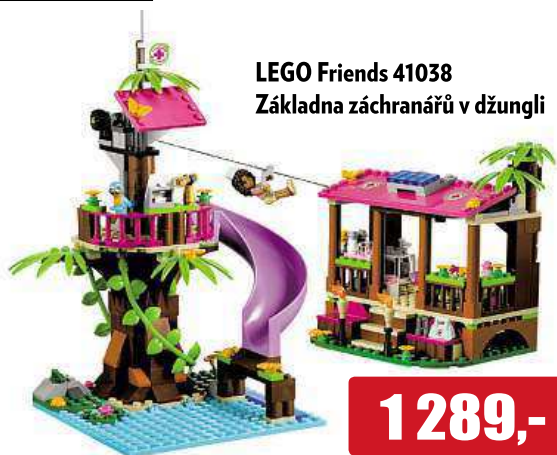
LEGO Friends 41038 Základna záchranářů v džungli