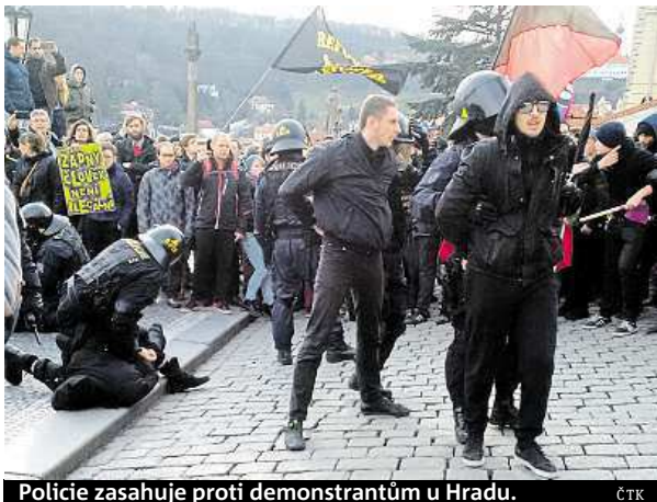
Policie zasahuje proti demonstrantům u Hradu.

Během demonstrace krajně pravicové Národní demokracie na Loretánském náměstí zadrželi jednadvacetiletého muže, který vystřelil do vzduchu z pistole na poplaš-