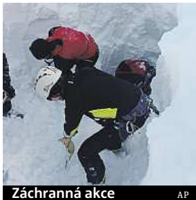
Záchranná akce AP

Celkem pod sněhovým závalem skončilo třináct českých lyžařů z dvaceti. Podle rakouských médií i místního chatáře byli Češi opakovaně varováni před vysokým lavinovým nebezpečím, ale neuposlechli. Lavinu ale podle rakouských úřa-