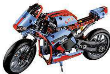
LEGO Technic 42036 Silniční motorka