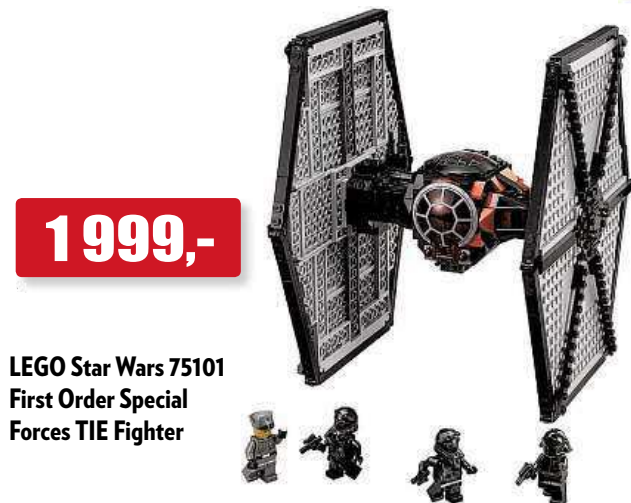
LEGO Star Wars 75101 First Order Special Forces TIE Fighter