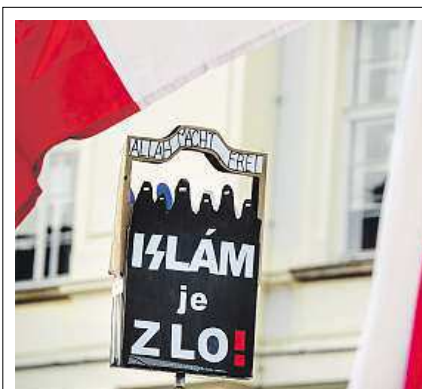
Demonstrace proti islámu v Evropě

Vlna protestů se nesla po celém kontinentu.