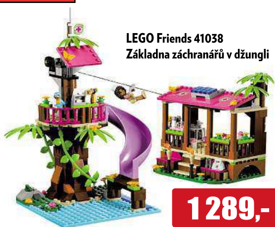
LEGO Friends 41038 Základna záchranářů v džungli