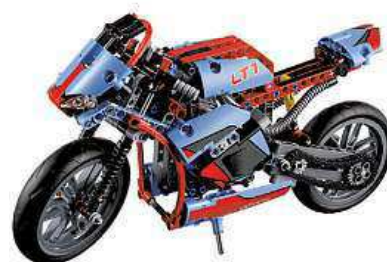
LEGO Technic 42036 Silniční motorka