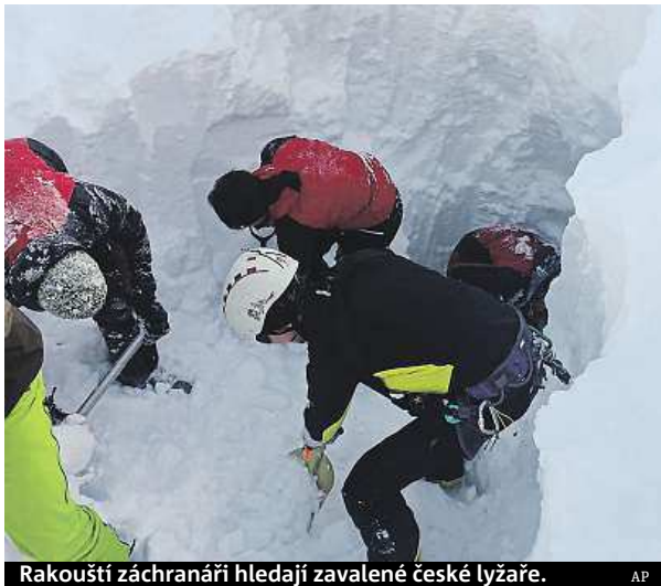
Rakouští záchranáři hledají zavalené české lyžaře.

Tři zranění skialpinisté už byli propuštěni z nemocnice. Všechny 12 Čechů, kteří nešťastí přežili, by se podle Valentové měli nejspíše v pondělí vrátit do Česka. České ministerstvo zahraničí odpoledne upřesnilo, že oběti jsou muži ve věku od 34 do 38 let.