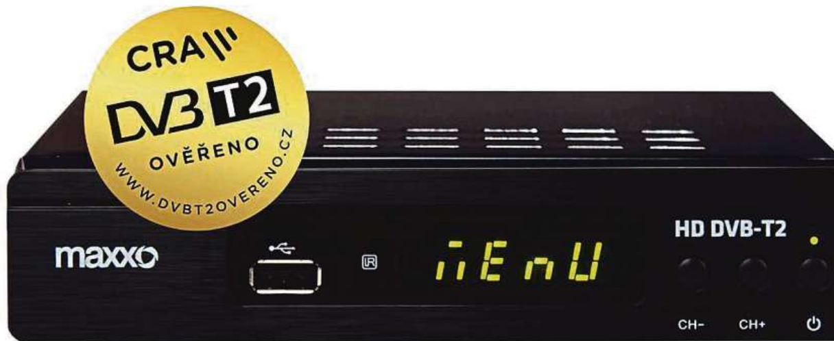
Jedno z nejšeststrannějších zařízení: MAXXO DVB-T2

Příprava na změnu je jednoduchá. Pokud si včas pořídíte nový televizní přijímač (takzvaný set-top box), již nyní získáte přístup k mnohým televizním kanálům ve vysokém rozlišení. Už v současnosti například ve většině oblastí naladíte programy České televize v HD kvalitě. Jaký přijímač tedy vybrat? Například internetový obchod Mironet doporučuje jako jedno z nejšeststrannějších zařízení set-top box MAXXO DVB-T2. Tato nenápadná černá krabíčka s ověřením Českých Radiokomunikací odpovídá všem novým standardům vysílání. Podporuje kodek HEVC H.265 i zvuk Dolby Atmos. Díky tomu je tento přijímač připra-