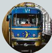
Lud Vík Stuard Většinou do té doby, dokud se nám to ještě líbí.