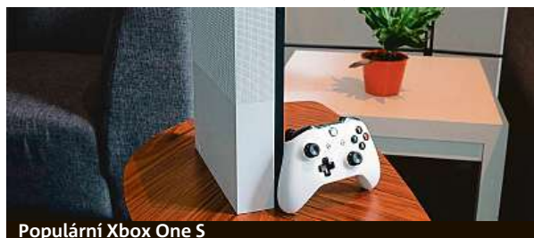
Populární Xbox One S

Už v základu se jedná o velmi dostupné zařízení, které co do výkonu stačí i na nové herní tituly. Jeho nejnovější verze „All-Digital Edition“ je ale ještě levnější. Čím se