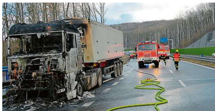
Autohavárie tvoří významnou část hasičské práce.

17 procent hasičských akcí, zatímco hašení požárů figuruje v hasičských tabulkách až na třetím místě se 14 procenty. „Zásahů u ohně ubylo o takřka deset procent,“ konstatuje Zadina. Kvůli nárůstu jiných nehod museli hasiči vyjždět o něco častěji než loni. Počet událostí, u nichž byla nezbytná jejich asistence, narostl o šest tisíc. PH