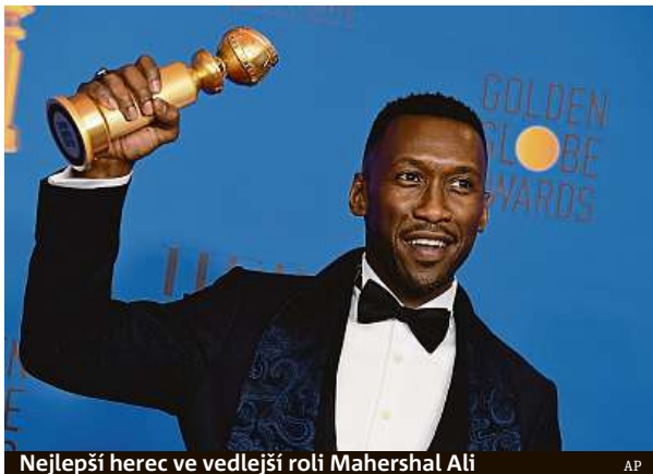
Nejlepší herec ve vedlejší roli Mahershal Ali

Cenu za nejlepší komediální roli získal Christian Bale. Vžil se do role bývalého viceprezidenta USA Dicka Cheneyho.