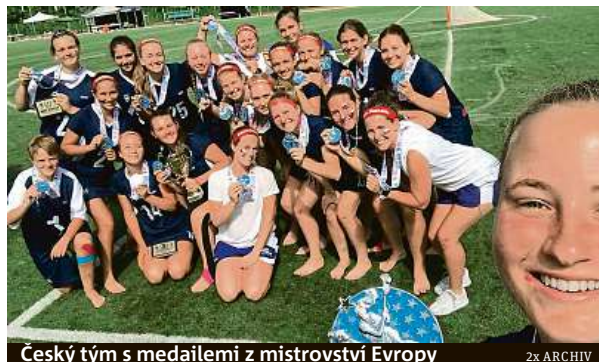
Český tým s medailemi z mistrovství Evropy