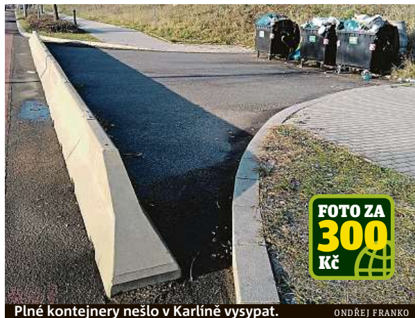
Plné kontejnery nešlo v Karlíně vysypat.