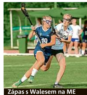
Zápas s Walesem na ME

• Přispět na jejich cestu můžete také na transparentní účet: 2300463516/2010.