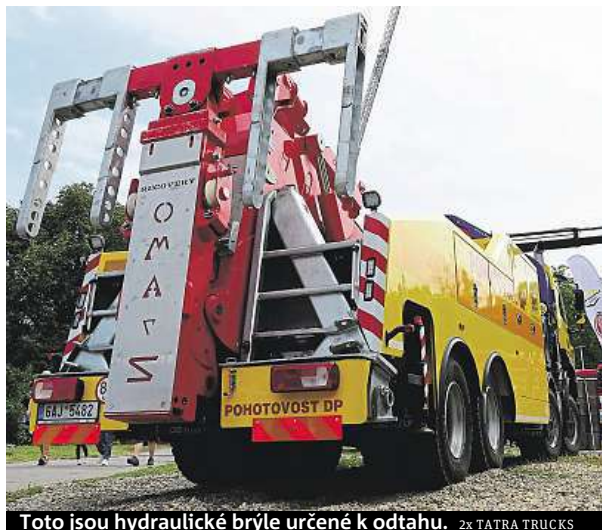
Toto jsou hydraulické brýle určené k odtahu. 2x TATRA TRUCKS

Vyprošťovací silák dopravního podniku šel do důchodu. Náhrada je ovšem ještě silnější.