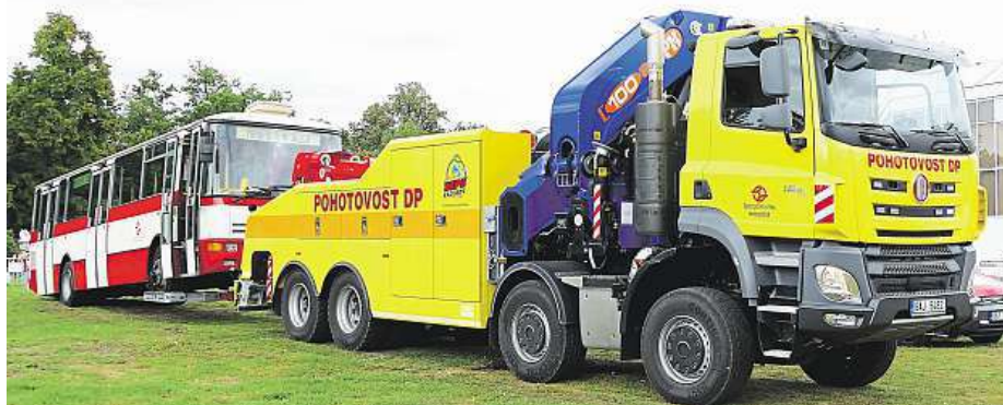
Odtahový speciál je postavený na podvozku Tatra Trucks Phoenix. Zde při ukázce síly.