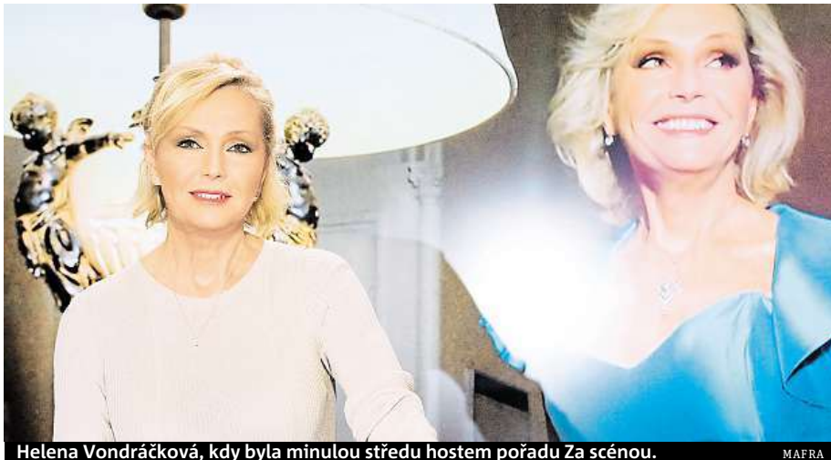
Helena Vondráčková, kdy byla minulou středu hostem pořadu Za scénou.