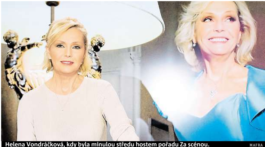
Helena Vondráčková, kdy byla minulou středu hostem pořadu Za scénou.