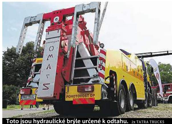
Toto jsou hydraulické brýle určené k odtahu. 2x TATRA TRUCKS

Vyprošťovací silák dopravního podniku šel do důchodu. Náhrada je ovšem ještě silnější.