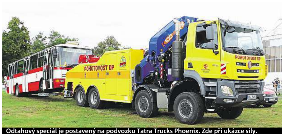
Odtahový speciál je postavený na podvozku Tatra Trucks Phoenix. Zde při ukázce síly.