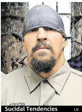
Suicidal Tendencies LN