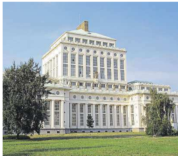
Podolská vodárna, symbol pražského vodárenství.

Po primitivních počátcích se objevily první vodárny, které vedly vodu do kašen. Skutečnou revolucí bylo 19. století, kdy voda hasila žízeň průmyslové revoluce. Odtud už byl jen krok k vodárnám, jak je známe dnes – k Podolské vodárně, úpravně na Želivce a ke Káranému. Pouta-