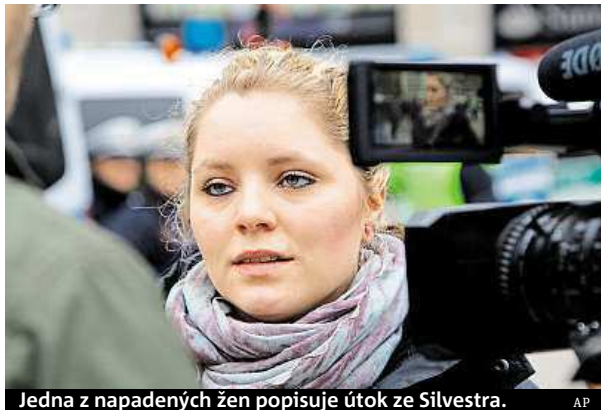
Jedna z napadených žen popisuje útok ze Silvestra.

Podle svých slov se bála, že pokud v davu oplzlých mužů zůstanou, mohli by je i zabít nebo znásilnit a nikdo by si toho nevšiml. „Pomyslela jsem si, že se s tím budeme muset smířit. Kolem nás nebyl nikdo, kdo by nám mohl pomoci. Přála jsem si jediné –