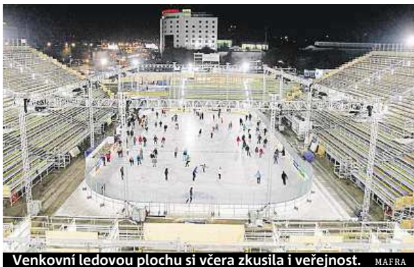
Venkovní ledovou plochu si včera zkusila i veřejnost.

Domácí hokejisté si na venkovní ploše zatrénovali včera a podívat se přišlo přes čtyři sta lidí. Sparta okusí led až během dnešního dopoledne.