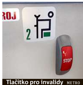
Tlačítko pro invalidy METRO

Knoflíky v MHD lidé mačkají nesprávně. Šoféři pak řeší nejen špatná zazvonění.