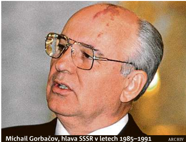
Michail Gorbačov, hlava SSSR v letech 1985–1991

Dne 8. prosince 1991 vyhrčila Bělověž šokující usnesení o zcela novém státním celku, v němž již chybělo celé Pobaltí. Jelcin jej nazval Společenství nezávislých států (SNS).