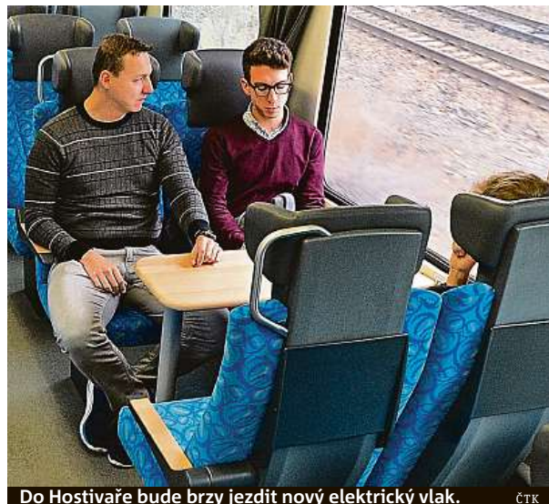
Do Hostivaře bude brzy jezdit nový elektrický vlak.

Letošní změna jízdních řádů a na ně navázaných autobusů je považována za jednu z největších v historii. Z hlediska najetých kilometrů totiž hlavní město objednává o zhruba osm procent více dopravních výkonů než dosud. Nové spoje přibudou například těm, kteří pendlují mezi hlavním městem a Kutnou Horou, případně Prahou a Benešovem. „V pondělí desátého na této trase vyjedou další spěšné vlaky. Budou jezdit ve špičkách pracovních dní