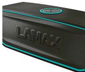
LAMAX Solitaire1 2x MIRONET

O tom, že přenosné reproduktory dokáží značně zpříjemnit život, není výrazných pochyb. Co už na první pohled ale tolik patrné není, je fakt, že jsou také nositeli mnoha inovativních technologií.