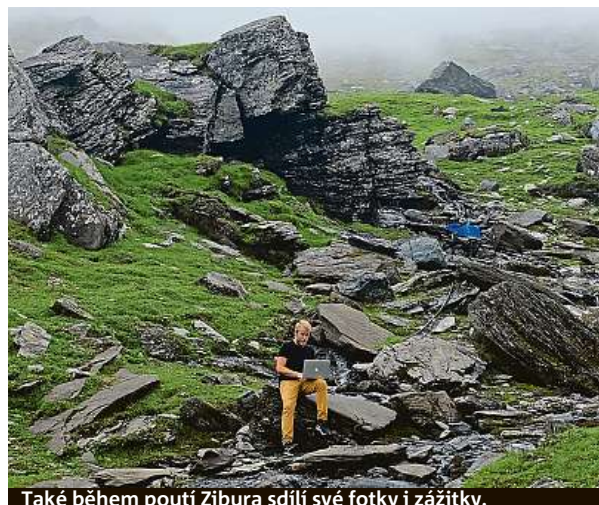
Také během poutí Zibura sdílí své fotky i zážitky.

Jasně a také mě čtou. Na začátku byli moje publikum vy-