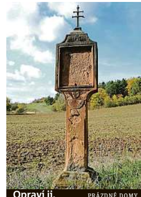
Opraví ji. PRÁZDNÉ DOMY

Svou pozornost zaměřil na Vrbici. „Vesnice je docela známá občanskými aktivitami místních lidí. Objevil