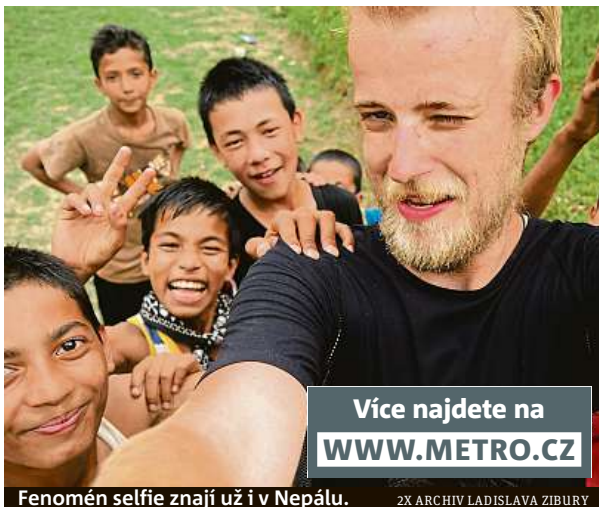
Fenomén selfie znají už i v Nepálu.

Já jsem trochu vzteklý, zejména když jsem nevyspalý nebo když se dostávám do stresových situací. Provázet