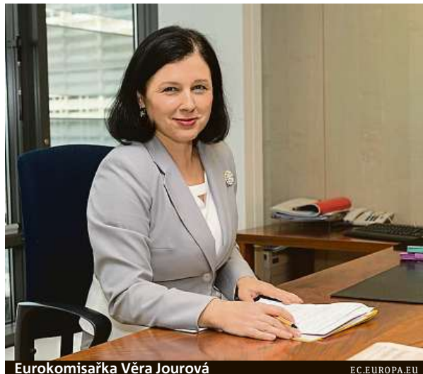
Eurokomisařka Věra Jourová

To ne, fakta nikdo nepřekrucuje ve prospěch Unie, spíš se informace natírají na růžovo. To dělají evropské politiky, to dělají národní politici. Já se tomu spíš snažím vy-