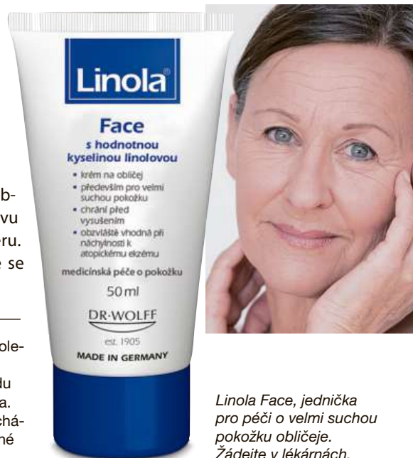
Linola Face, jednička pro péči o velmi suchou pokožku obličejové. Žádejte v lékárnách.