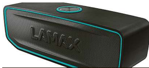
LAMAX Solitaire1 3x MIRONET

O tom, že přenosné reproduktory dokáží značně zpříjemnit život, není výrazných pochyb. Co už na první pohled ale tolik patrné není, je fakt, že jsou také nositeli mnoha inovativních technologií.