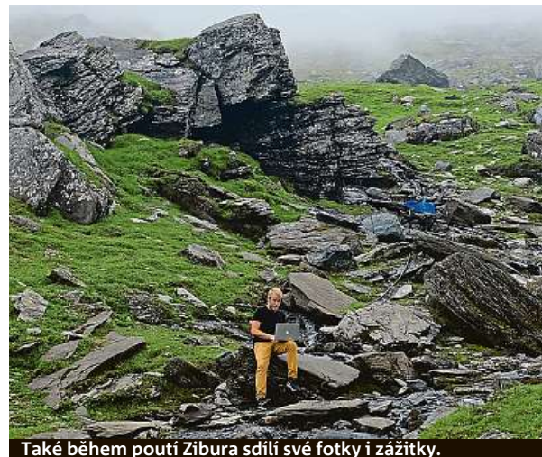
Také během poutí Zibura sdílí své fotky i zážitky.

Jasně a také mě čtou. Na začátku byli moje publikum vy-