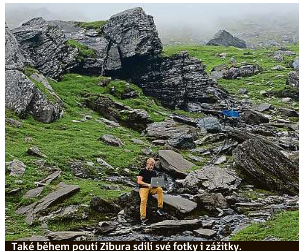
Také během poutí Zibura sdílí své fotky i zážitky.

Jasně a také mě čtou. Na začátku byli moje publikum vy-