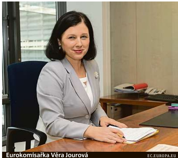
Eurokomisařka Věra Jourová

To ne, fakta nikdo nepřekrucuje ve prospěch Unie, spíš se informace natírají na růžovo. To dělají evropské politiky, to dělají národní politici. Já se tomu spíš snažím vy-