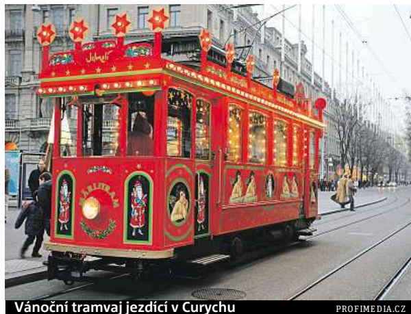
Vánoční tramvaj jezdící v Curychu

ze, který sbírá od dětí dopisy s vánočními přáními. Připravte se ale na fronty. „Rusové hodně dbají na bezpečnost a na místech s větší koncentrací lidí provádějí důkladné kontroly. Před vstupem na Rudé náměstí si v některých časech počkáte třeba i hodinu,“ dodává Trejbal.