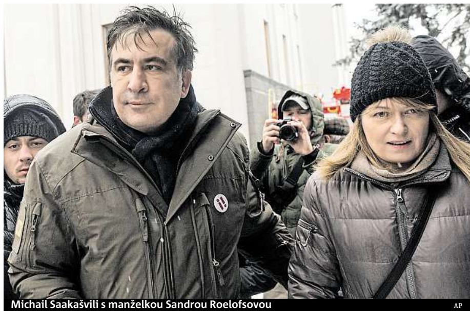
Michail Saakašvili s manželkou Sandrou Roelofsovou

Policie včera ráno provedla zátah na stanové městečko demonstrantů. Během něj utrpělo zranění několik lidí, které policie údajně zbila. Expresident vyzval Porošenka, aby zastavil útoky na aktivisty. ČTK, MET