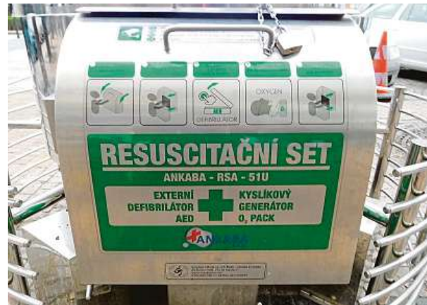
Resuscitační set je součástí záchraného sloupu s kyslíkovou nádobou, který se šest let nachází na Václavském náměstí.

Co dělat když člověk nedýchá? Co dělat když je člověk v bezvědomí? To jsou znalosti, které jsou nutné k provedení laické první pomoci. Z vaší praxe máte mnoho zkušeností z terénu, kdy tyto základy lidé moc nezvládali. Můžete pro čtenáře popsat, jak na to správně?