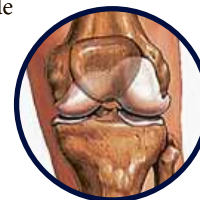
Defekty chrupavky zmizí do 24 hodin.