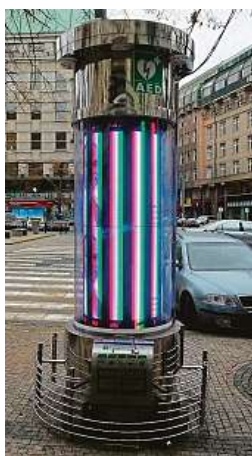
Inovativní záchraný sloup najdete na Václavsku.