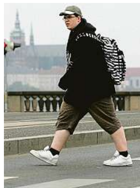
Chodec jde mimo přechod. Jak posoudit střet s autem? MAFRA

„Je možné, že se může na nehodě v určitém spoluzavinění podílet i chodec. Pokud dojde ke střetu mimo přechod,“ připomíná advokát Schulhauser. Výklad policie