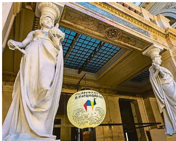
Letos se zájemci mohou tradičně těšit na sérii přednášek.

Výsledky svého výzkumu publikoval v desítkách děl, které se věnovaly českému dělnictvu, jeho bydlení a každodennímu životu, dějinám koncertu Baťa a moderním náboženským dějinám. Popularizaci vědy věnoval projekt