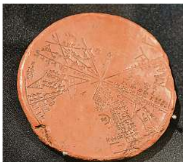
Sumerská hvězdná planisféra