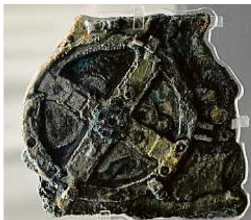
Část mechanismu z Antikythéry