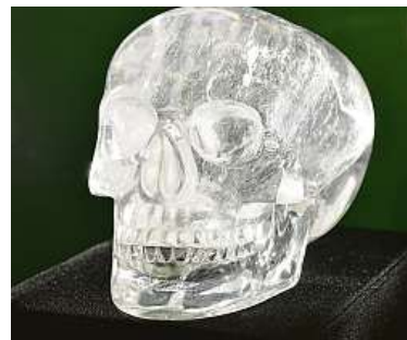
Mitchell-Hedgesova křišťálová lebka