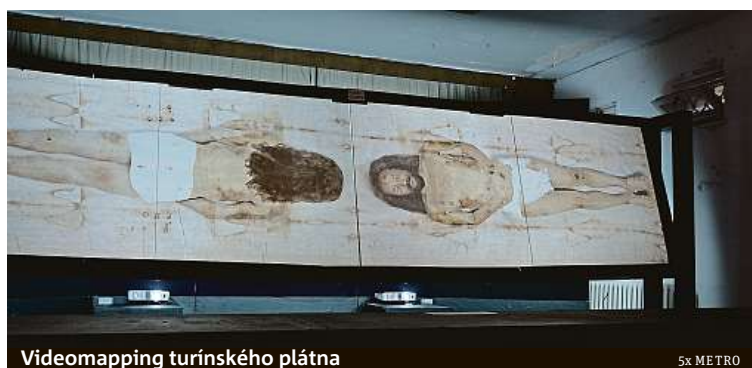
Videomapping turínského plátna

Lohmann & Rauscher, s.r.o., Bučovická 256, 684 01 Slavkov u Brna.