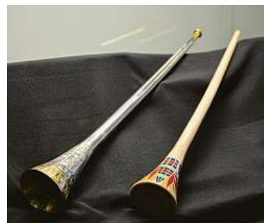
Tutanchamonovy válečné trubky