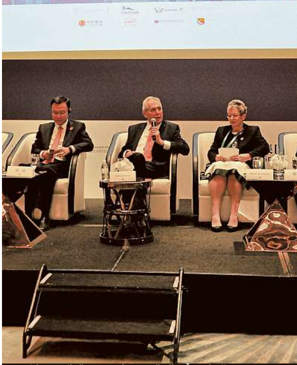
Prezident Miloš Zeman (uprostřed) v Šanghaji