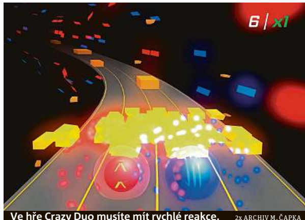
Ve hře Crazy Duo musíte mít rychlé reakce.

Pracoval jsem na prototypu do World of Tanks a na hře Take Cover ve firmě Gamajun games. Dále jsem vyvíjel hru v herním studiu Alda games s názvem Band of Defenders. Mám za sebou přes pět let vývoje mimo herní průmysl a přes tři roky v herním průmyslu. Díky tomu můžu