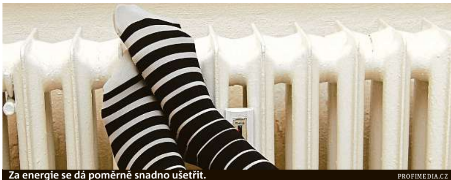
Za energie se dá poměrně snadno ušetřit.

V zimě větrejte krátce a intenzivně. Nepřetápějte místnosti – každý stupeň nad 20 °C zvýší spotřebu energie o šest procent. Nevypínejte topení, když nejste doma – stěny zbytečně chladnou a potřebují následně více tepla na zahřátí – navíc se mohou rosit