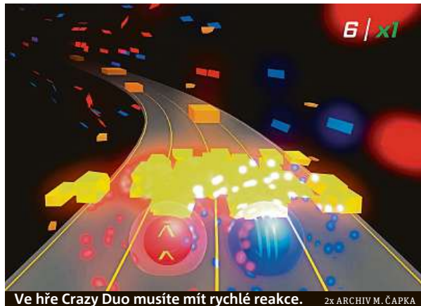
Ve hře Crazy Duo musíte mít rychlé reakce.

Pracoval jsem na prototypu do World of Tanks a na hře Take Cover ve firmě Gamajun games. Dále jsem vyvíjel hru v herním studiu Alda games s názvem Band of Defenders. Mám za sebou přes pět let vývoje mimo herní průmysl a přes tři roky v herním průmyslu. Díky tomu můžu