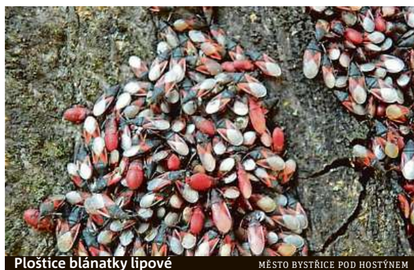
Ploštice blánatky lipové

nejde o škůdce a nemůže to lípě ublížit,“ popsal Tomáš Svačina z radničního odboru životního prostředí. Odborníci zjistili, že strom obsadily kolonie ploštice blánatky lipové. V takovém množství ji v Bystřici zaregistrovali poprvé. Původně středomořský druh se do Česka dostal teprve před několika lety a podobné shluky jsou na stromech k vidění jen výjimečně. „Shluky zůstávají pohromadě až do jara, kdy se jednotliví jedinci začínají rozlézat do