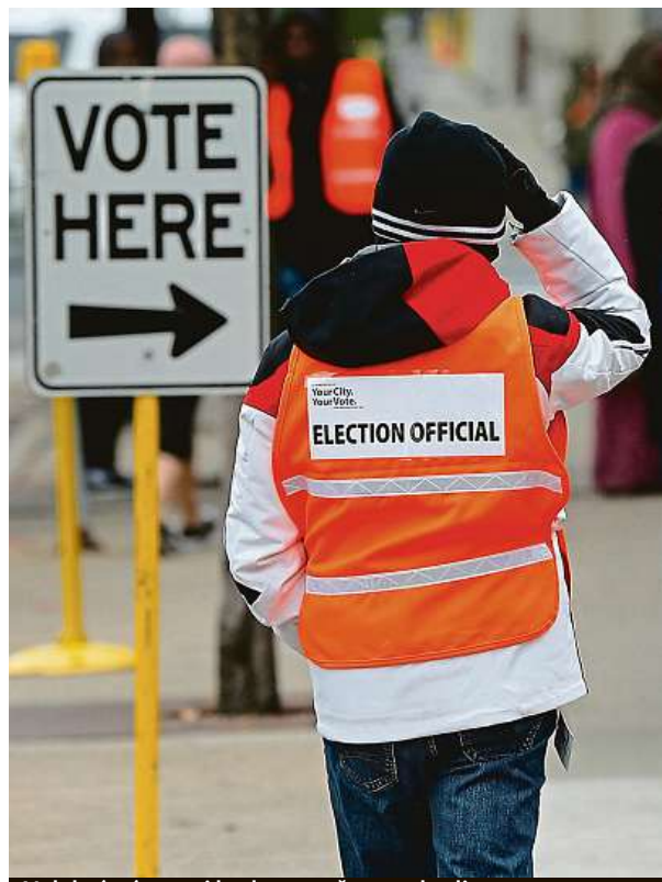
Volební místnosti budou otevřeny 12 hodin.