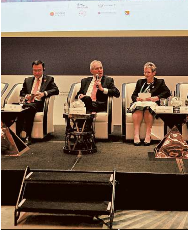
Prezident Miloš Zeman (uprostřed) v Šanghaji