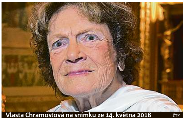
Vlasta Chramostová na snímku ze 14. května 2018

S velkou postavou českého disentu, Vlastou Chramostovou, se lidé mohou rozloučit za týden v Praze.