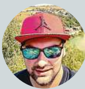
Martínek Karaba Djkarry IDOS.