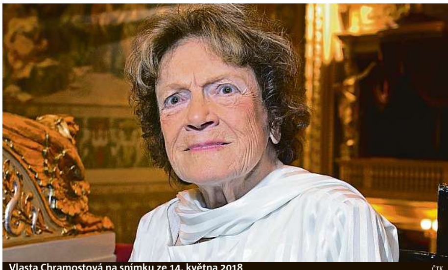
Vlasta Chramostová na snímku ze 14. května 2018

„Pokud si někdo zaslouží pohřeb se státními poctami, je to právě Vlasta Chramostová,“ uvedl předseda Ústavního soudu a signatář Charty 77 Pavel Rychetský. Reagoval tak na včerejší úmrtí divadelní a filmové herečky a rovněž signatářky Charty 77 Vlasty Chramostové. Pohřeb se státními poctami připravuje vláda ve spolupráci s rodinou pro zpěváka Karla Gotta, který zemřel v úterý. Další z brněnských signatářů Charty 77, brněnský dramatik Milan Uhde, označil Chramostovou za nezapomenutelnou. „Byl jsem její věrný divák, byla to vynikající herečka disponovaná zejména pro hrdinské role. Byla to i neobyčejně statečná žena, která vykonala obrovskou práci,“ řekl dramatik Uhde.