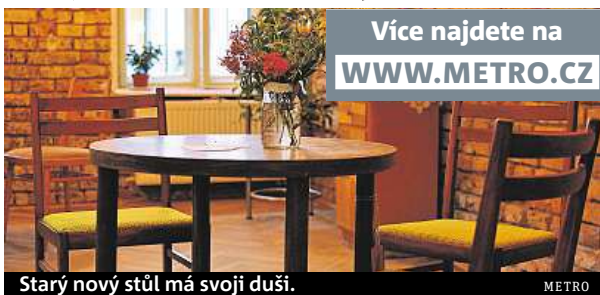
Starý nový stůl má svoji duši.