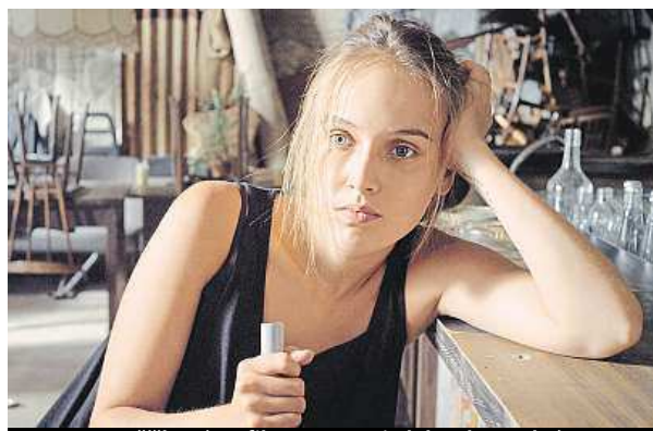
Postava Voříškové ve filmu Laputa je lehce bezradná. BIOSCOP

Je to hrozně rozpolcené. Část naší generace žije tak, jak o tom vypráví film. Můžou všechno a nevědí co by vnitřně. Nemáme, proti čemu se vymezovat. Je tady ale i ta druhá polovina, což jsou ambiciózní mladí lidé, kteří vydělávají velké peníze a jsou úspěšní ve svých oborech, a to už v mladém věku.