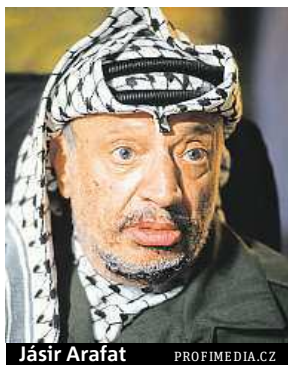
Jásir Arafat

Nutno podotknout, že s odstupem času došlo především