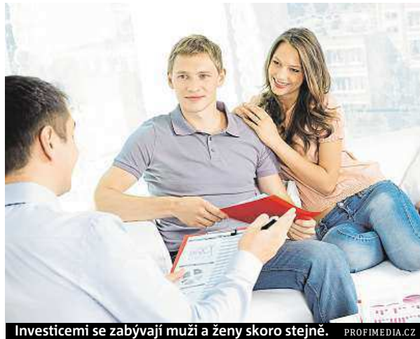
Investicemi se zabývají muži a ženy skoro stejně.

K nejbezpečnějším investicím stále patří nemovitosti, případně investiční produkty vydávané či garantované státem. „Na druhé straně v současné době už tak výhodným zhodnocením financí není například stavební spoření. Základní podmínkou úspěchu je zjištění co možná nejvíce informací o daném způsobu investování. Informovanost je asi nejvýznamnější podmínkou úspěšné investice. Důležité také je sledování trhu – co bylo výhodné před rokem, ale i před čtvrtrokiem, už dnes může být riskantní,“ uvedl k problému Malý.