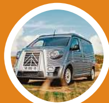
Citroën ukázal dodávku aka Type H.