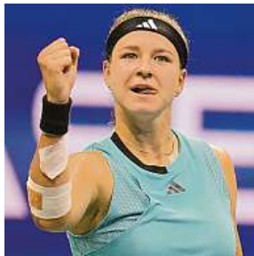
Karolína Muchová se raduje z postupu do semifinále.

Bývalá světová jednička ve čtyřhře Strýcová ukončila kariéru kvůli těhotenství v roce 2021. Po narození syna Vincenta se vrátila letos v dubnu na krátkodobé turné. Zúčastnila se turnajů v Madridu, Římě, Birminghamu, Eastbourne i grandslamového Wimbledonu, kde vyhrála stejně jako v roce 2019