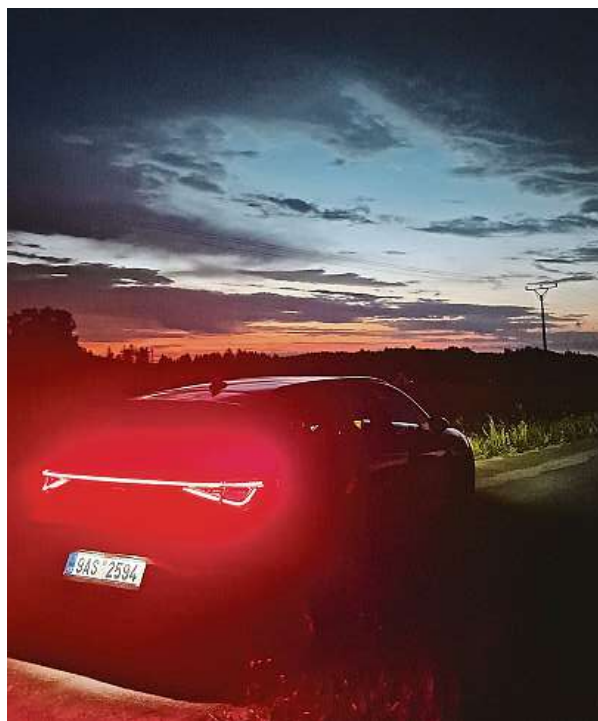
Leony, ať už od Seatu nebo Cupry, poznáte v noci snadno – zadní lampy spojuje světelná linka. Zde nad ránem na Vysočině. 2x METRO