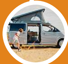
Základem kemperu je vůz SpaceTourer.