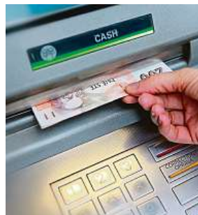
Hledání nejbližšího bankomatu může být zážitkem.

V době covidové se zdálo, že se Česko přece jen přikloní, podobně jako například severské státy, k co nejvyššímu podílu bezhotovostních plateb. To se ale změnilo. Lidé se postupně vracejí k hotovostním transakcím.