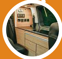
Uvnitř je kuchyňský kout s prostorem pro vaření, dřezem a lednicí. 3x CITROËN