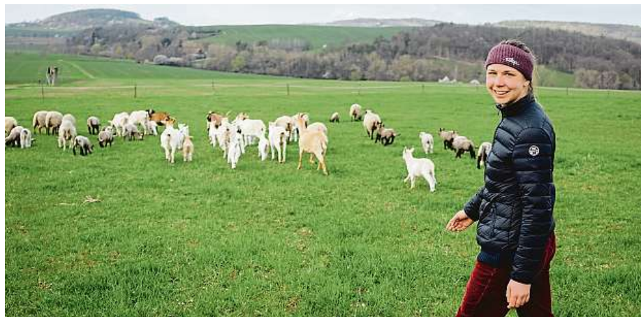
Biodynamické zemědělství zdůrazňuje udržitelnost, biodiverzitu a harmonii mezi půdou, rostlinami, zvířaty a lidmi.