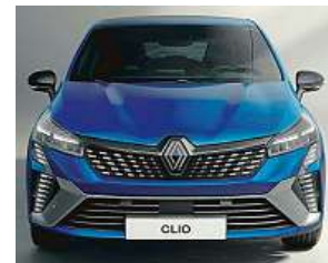
Renault Clio je hit po celém světě, zatopí české fabii? RENAULT

Renault pokračuje v letošní smršti představování nových modelů. Po velkoprostorovém Renaultu Espace teď přišlo na řadu malé Clio, které po konci Twinga tvoří základ nabídky. Kromě úplně nového dramatického „čumáku“ je přepracovaný i interiér. Skvělé je, že po předchůdci zdědila novinka širokou paletu motorů včetně hybridu.