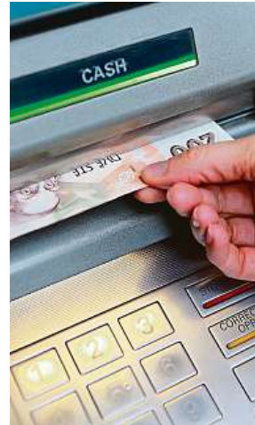
Hledání nejbližšího bankomatu může být zážitkem.

Tolik mincí připadalo v roce 2022 na jednoho obyvatele České republiky.