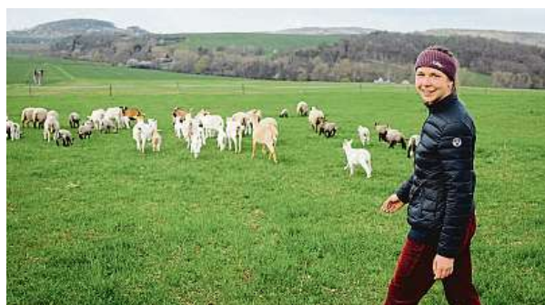
Biodynamické zemědělství zdůrazňuje udržitelnost, biodiverzitu a harmonii mezi půdou, rostlinami, zvířaty a lidmi.

Výuka vychází z konceptu dostupného například v Německu, Švýcarsku, Anglii či Francii, kde se klade důraz na praxi. „Na mém předchozím studiu na vysoké škole mi vadilo, že bylo zaměřené zejména na teorii, proto jsem z něj po třech letech odešla zklamaná. Farmářská škola mě zaujala právě tím, že byla založená hodně na praxi a součas-