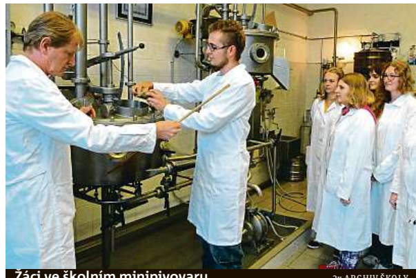
Žáci ve školním minipivovaru

naše absolventy. Ať už malý, nebo velký. Počínaje minipivovary v Krkonoších přes Plzeňské pivovary, Staropramen, Radegast, Svijany nebo Heineken atd. Všude tam jsou naši absolventi. Nyní především naplňují tu největší poptávku v minipivovarech. Zájem mají i velké pivovary, ale tam je to komplikovanější. My máme vlastní školní minipivovár, ve kterém se žáci učí výrobu piva, aby poznali veškeré technologické postupy. Je to takový minimodel minipivovaru, zatímco