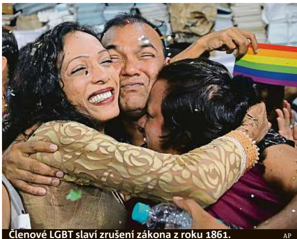
Členové LGBT slaví zrušení zákona z roku 1861.

V roce 2009 soud v metropoli Dillí homosexuální styk kriminalizoval. Jeho rozhodnutí ale v roce 2013 zvrátil Nejvyšší soud, který obnovil platnost zákona z roku 1861, jenž pohlavní styk mezi homosexuály zakazuje. Zdůvodnil to tehdy tím, že měnit zákony má parlament, nikoli soudy. V roce 2016 ale Nejvyšší soud uvedl, že záležitost znovu přezkoumá. Aktivisté bojující za lidská práva ver-