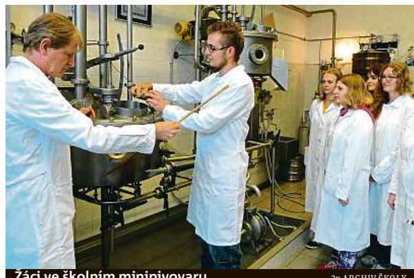
Žáci ve školním minipivovaru

naše absolventy. Ať už malý, nebo velký. Počínaje minipivovary v Krkonoších přes Plzeňské pivovary, Staropramen, Radegast, Svijany nebo Heineken atd. Všude tam jsou naši absolventi. Nyní především naplňují tu největší poptávku v minipivovarech. Zájem mají i velké pivovary, ale tam je to komplikovanější. My máme vlastní školní minipivovar, ve kterém se žáci učí výrobu piva, aby poznali veškeré technologické postupy. Je to takový minimodel minipivovaru, zatímco