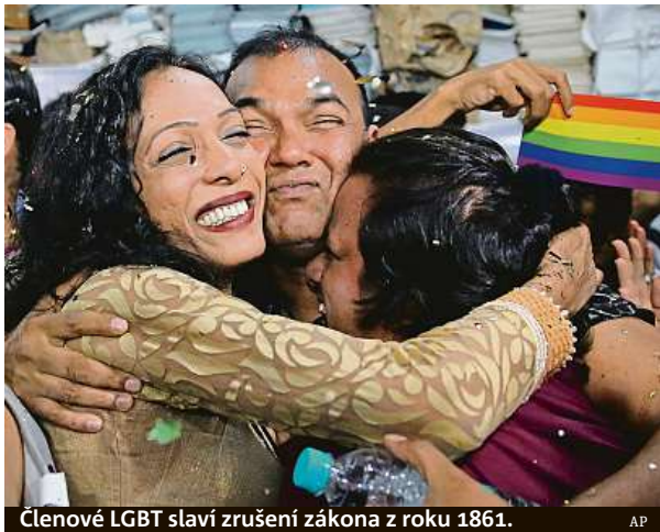
Členové LGBT slaví zrušení zákona z roku 1861.

V roce 2009 soud v metropoli Dillí homosexuální styk dekriminlizoval. Jeho rozhodnutí ale v roce 2013 zvrátil Nejvyšší soud, který obnovil platnost zákona z roku 1861, jenž pohlavní styk mezi homosexuály zakazuje. Zdůvodnil to tehdy tím, že měnit zákony má parlament, nikoli soudy. V roce 2016 ale Nejvyšší soud uvedl, že záležitost znovu přezkoumá. Aktivisté bojující za lidská práva ver-