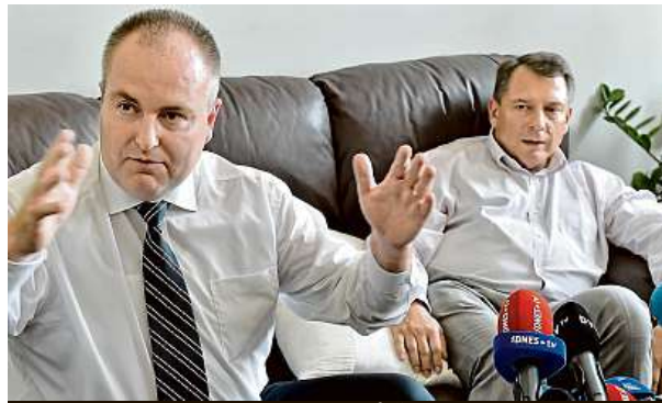
Podnikatel a premiér mluví o půjčce.

Expremiér v potížích. Kam zmizely miliony? A odkud je vlastně vzal?