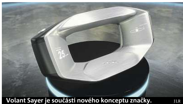
Volant Sayer je součástí nového konceptu značky.

Jmenuje se po jednom z nejvýznamnějších designérů značky Jaguar, Malcolm Sayerovi. HOŠ