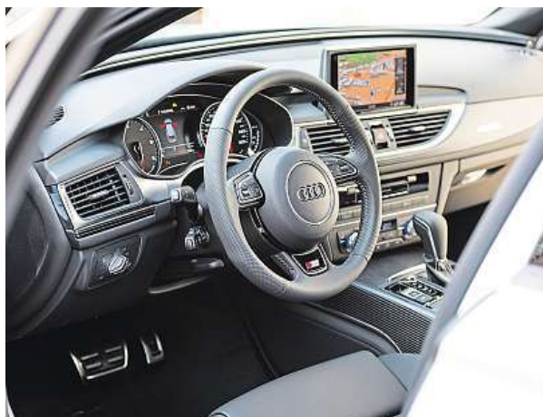
V kokpitu se u nové generace odehraje plno změn.

Avant, jak Audi kombíkům říká, patří k limitované sérii Competition, kterou Audi oslavuje 25. výročí motorů TDI a představil ji už u sedánku A6. I u kombi zahrnuje sportovní paket S line s krásnými dvacetipalcovými koly. Takže když si odmyslíte zastaralé kokpit, kde chybí velká dotyková obrazovka a digitální budíky, a skousnete také