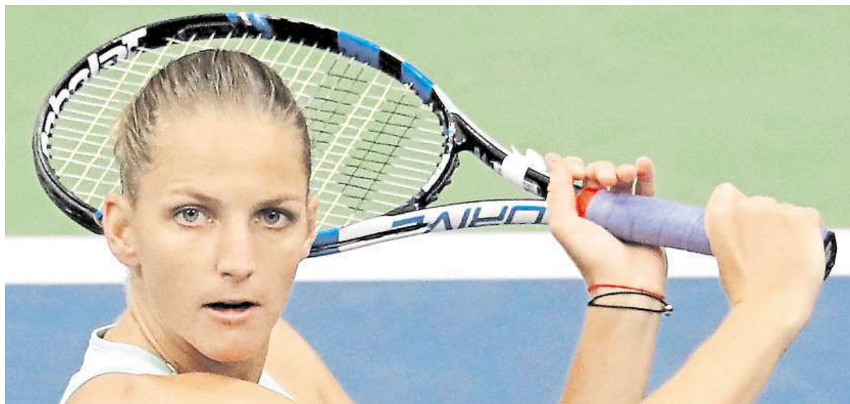
Tenistka Karolína Plíšková vypadla z grandslamového US Open ve čtvrtfinále a přijde o post světové jedničky. Více strana 23

Doporučení ministerstva. Nejenom vejce, ale i vaječné výrobky jsou od včera v Česku pod kontrolou státu. Opatření v Evropě. Z regálů supermarketů byly staženy miliony vajec kvůli hrozbě jedovatých toxinů STRANA 8