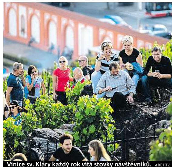
Vinice sv. Kláry každý rok vítá stovky návštěvníků.

Sklizeň vína se slaví na mnoha místech v hlavním městě.