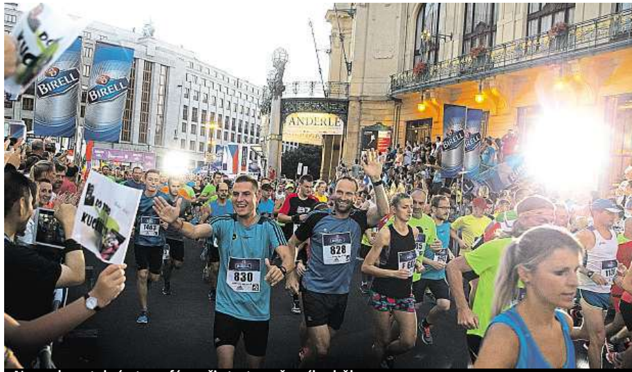
Neopakovatelná atmosféra při startu večerního běhu

Za každého běžce, který proběhne modrou bránou, přispěje Birell 5 Kč na nákup sportovního vybavení pro Nezastavitelné. Desetikilometrového závodu Birell Grand Prix, který spojuje běžce všech výkonnostních úrovní, zdravé i handicapované, se