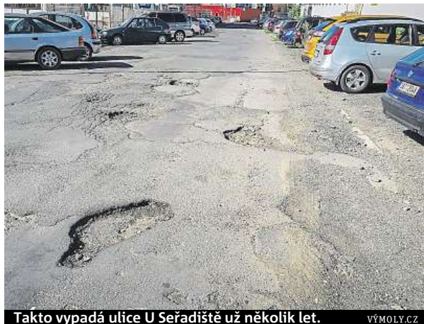
Takto vypadá ulice U Seřadiště už několik let.

„Letos motoristé upozornili na více než 1700 silničních úseků, které vyžadují opravu. Třetina z nich se už přitom renovace dočkala,“ říká Jan Marek z pojišťovny Generali. Nejvíce výmolů, které motoristé letos nahlásili, se