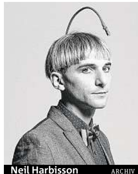
Neil Harbisson

„Nevyužívám technologii ani ji nenosím. Jsem technologií. Anténa je součástí mého těla a čip je dalším rozšířením mého mozku. Nemám pocit, že nosím nějakou technologii, a také jsem opravdu kyborgem.“ říká pro deník Metro Harbisson. První kyborg na světě vystoupí jako řečník