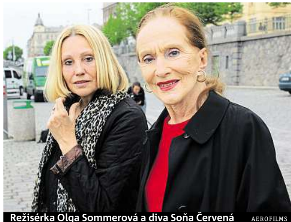
Režisérka Olga Sommerová a diva Soňa Červená

Červená se ve filmu zcela otevře režisérce Olze Sommerové. Hovoří o četných příkrocích, kterých se jí i rodině dostávalo od nacistů i komunistů, a nezastírá poněkud problematické vztahy s rodiči.