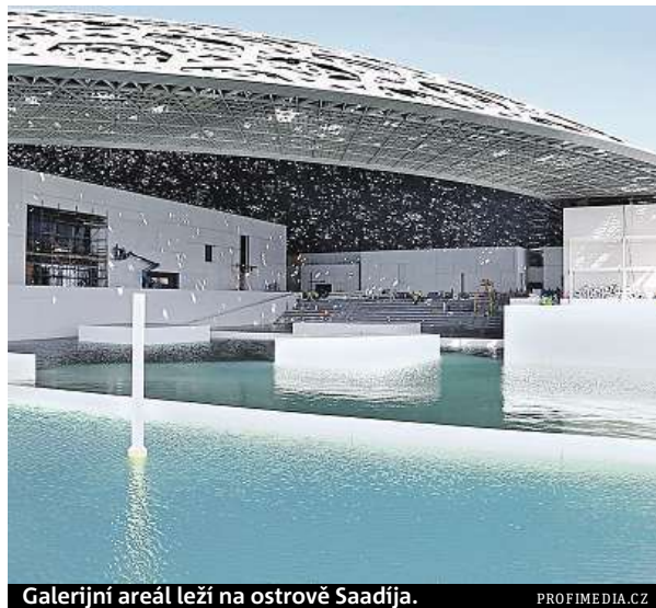
Galerijní areál leží na ostrově Saadija. PROFIMEDIA.CZ

Hlavní budova má velkou kupolovitou střechu s průměrem 180 metrů. Střechu pokrývá 7850 kovových geometrických tvarů, které dohromady tvoří mřížkový vzor, jímž do budovy prostupuje světlo. Sám Nouvel střechu popsal jako slunečník vytvářející záplavu světla. Galerijní areál leží na ostrově Saadija, jehož západní stranu tvoří kulturní čtvrť. Kromě Louvru tu budou další galerie, například odbočka newyorského Guggenheimova muzea navržená americkým architektem Frankem Gehrym, spoluautorem pražského Tančícího domu. ČTK, MET