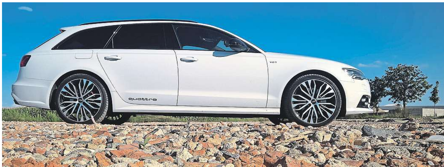
Siluetu Audi A6 Avant je i přes svoje stáří stále přitažlivá. Mluví se však o tom, že nová generace bude mít téměř rovnou střechu. Uvidíme.