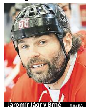
Jaromír Jágr v Brně

„Abych vysvětlil, proč jsem to vůbec řekl, tak si myslím, že každý člověk, potřebuje v životě i v zaměstnání mít