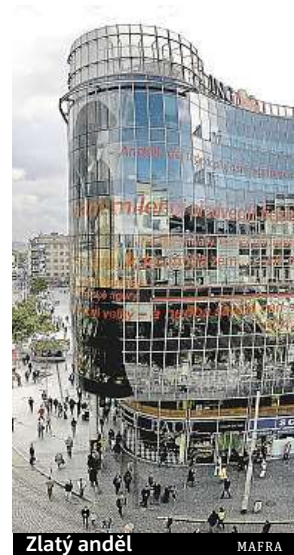
Zlatý anděl MAFRA