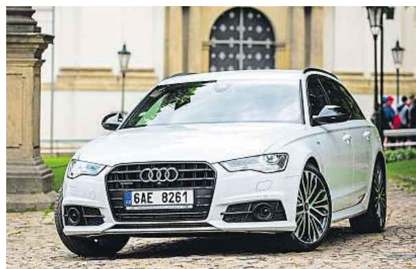
Audi A6 Avant