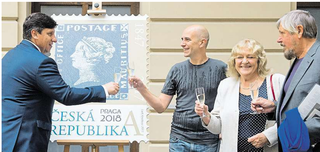
Pošta vydala známku s motivem jedné z nejceněnějších poštovních známek, Modrého Mauritia. Má hodnotu 16 korun.

Doporučení ministerstva. Nejenom vejce, ale i vaječné výrobky jsou od včera v Česku pod kontrolou státu. Opatření v Evropě. Z regálů supermarketů byly staženy miliony vajec kvůli hrozbě jedovatých toxinů STRANA 5