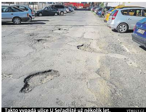
Takto vypadá ulice U Seřadiště už několik let.

„Letos motoristé upozornili na více než 1700 silničních úseků, které vyžadují opravu. Třetina z nich se už přitom renovace dočkala,“ říká Jan Marek z pojišťovny Generali. Nejvíce výmolů, které motoristé letos nahlásili, se