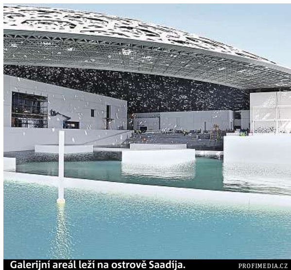
Galerijní areál leží na ostrově Saadija.

Hlavní budova má velkou kupolovitou střechu s průměrem 180 metrů. Střechu pokrývá 7850 kovových geometrických tvarů, které dohromady tvoří mřížkový vzor, jímž do budovy prostupuje světlo. Sám Nouvel střechu popsal jako slunečník vytvářející záplavu světla. Galerijní areál leží na ostrově Saadija, jehož západní stranu tvoří kulturní čtvrť. Kromě Louvru tu budou další galerie, například odbočka newyorského Guggenheimova muzea navržená americkým architektem Frankem Gehrym, spoluautorem pražského Tančícího domu. ČTK, MET