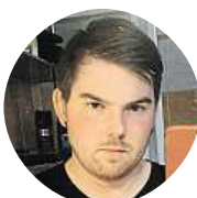
Tom Ekan Derka Dálnice D1 jako příklad pro všechny.