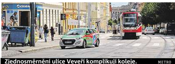
Zjednosměrnění ulice Veveří komplikují koleje. METRO