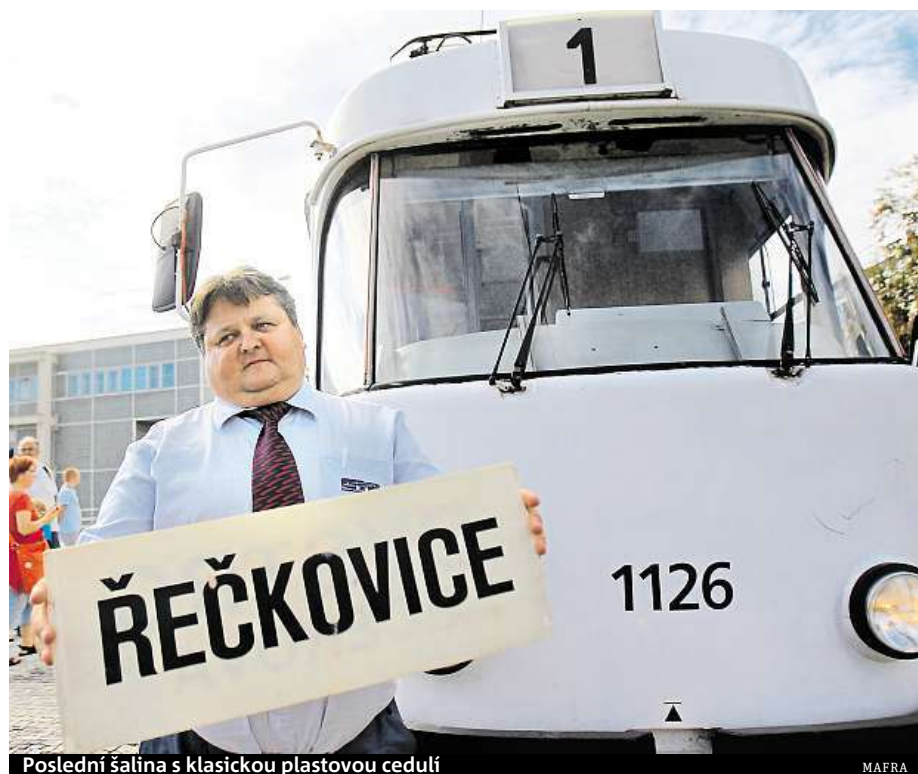
Poslední šalina s klasickou plastovou cedulí