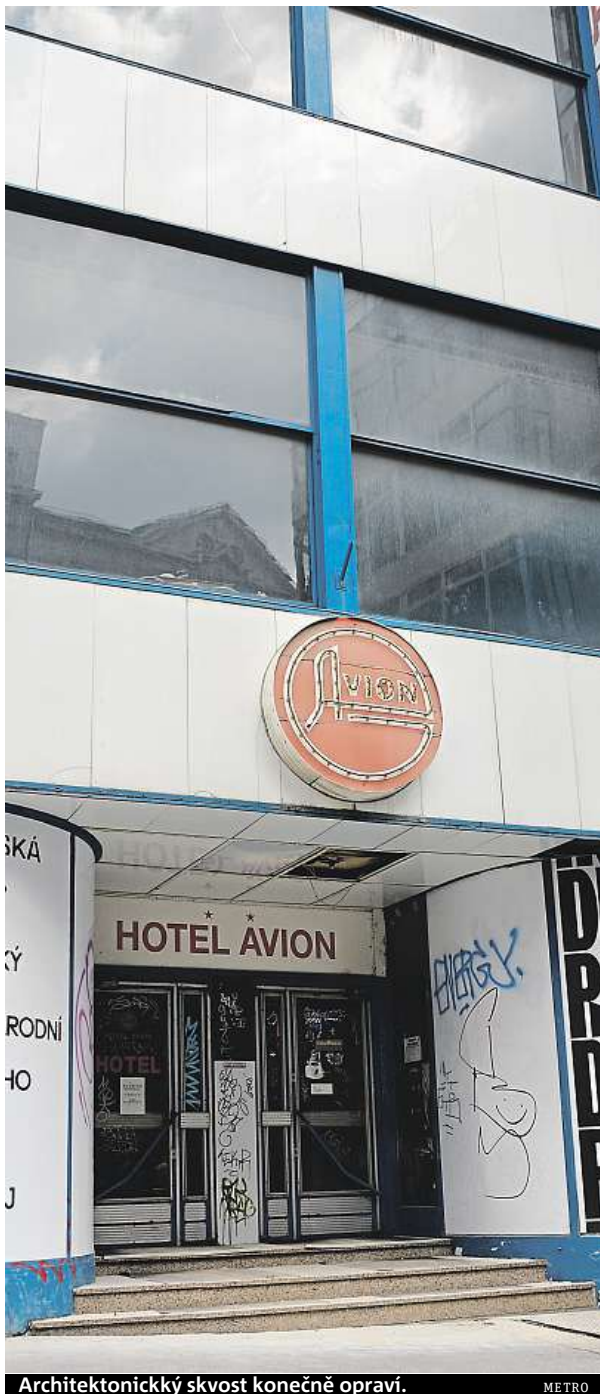
Architektonický skvost konečně opraví.