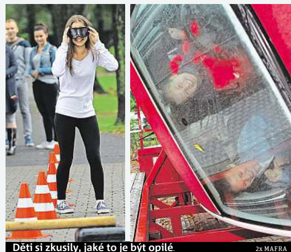
Děti si zkusily, jaké to je být opilé.