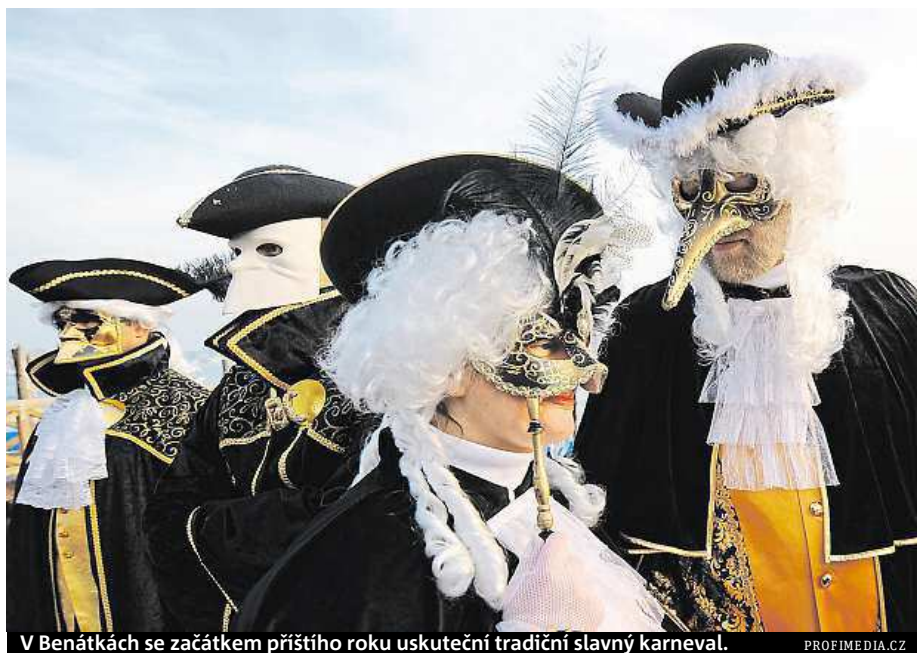
V Benátkách se začátkem příštího roku uskuteční tradiční slavný karneval.