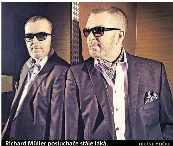
Richard Müller posluchače stále láká.

Pojedu se svou kapelou, ale taky s hostem, kytaristou An-