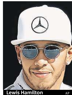
Lewis Hamilton

Brit Lewis Hamilton z Mercedesu s převahou vyhrál Velkou cenu Itálie a oslavil jubilejní 40. vítězství ve formuli 1. Sebastian Vettel z Německa vybojoval druhé místo pro domácí stáj Ferrari, zatímco jeho finský týmový kolega Kimi Räikkönen z boje o prvenství vypadl hned při nepovedeném startu z první řady. Třetí skončil Brazilec Felipe Massa z Williamsu, kterému na stupně vítězů pomohla porucha mercedesu Nica Rosberga těsně před cílem. ČTK