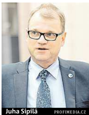
Juha Sipilä

Své krajany zároveň vyzval, aby ukázali solidaritu s uprchlíky, kteří do Evropy utíkají před válkou a chudobou. Finský premiér uvedl, že plán Evropské komise na rozdělení 160 tisíc migrantů po všech zemích osmdvacítky by měl být dobrovolný a že doufá, že se Finsko v tomto ohledu ukáže jako příkladná