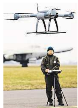
Na letišti Kbely v Praze

• Provoz bezpilotních letadel bez patřičných povolení úřadu může být předmětem sankčního řízení s možností udělení pokuty až do výše pěti milionů korun.