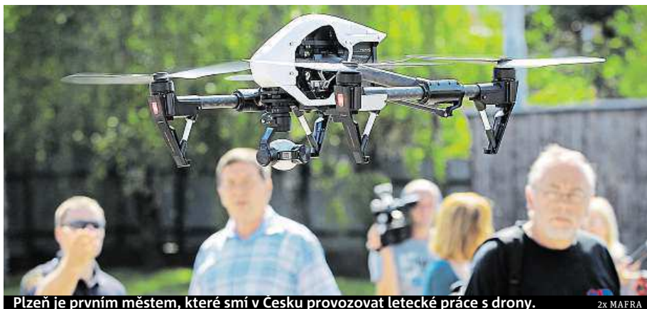
Plzeň je prvním městem, které smí v Česku provozovat letecké práce s drony.