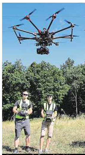
Dron společnosti E.ON