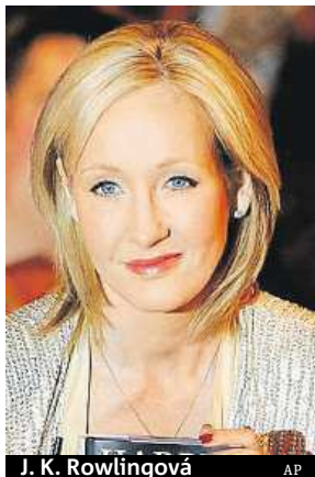
J. K. Rowlingová

Zopakovala, že podle ní děti potřebují rodinu, ne ústav.